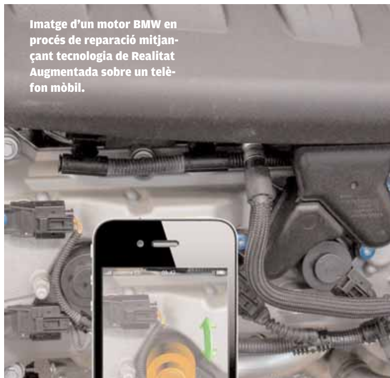
Imatge d'un motor BMW en procés de reparació mitjançant tecnologia de Realitat Augmentada sobre un telèfon mòbil.

BMW M3 (420CV). Les tecnologies de Realitat Augmentada (RA) permeten que els usuaris puguen percebre la realitat superposant als objectes reals models 3D recreats per un computador en temps real. Aquestes tecnologies estan tenint últimament un fort auge a causa de l'ús dels telèfons mòbils com a dispositius per a la recreació en temps real de la informació visual en 3D. No obstant això, i a pesar d'una gran difusió mediàtica, són molt poques les solucions comercials que empren aquestes tecnologies amb propòsits industrials. En qualsevol cas, els costos de desenvolupament i adaptació de les solucions de RA solen ser prohibitius