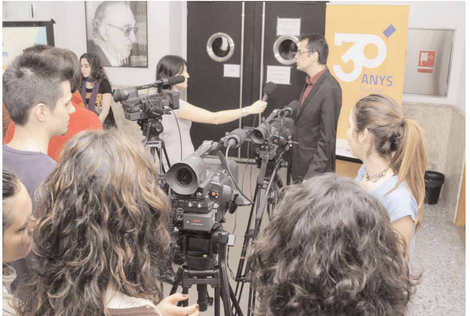
Els estudiants estan elaborant un documental sobre la història recent del periodisme valencià.

Al seu torn, Alborch va suscitar una certa polèmica en incidir en el descrèdit que pateixen tant periodistes com