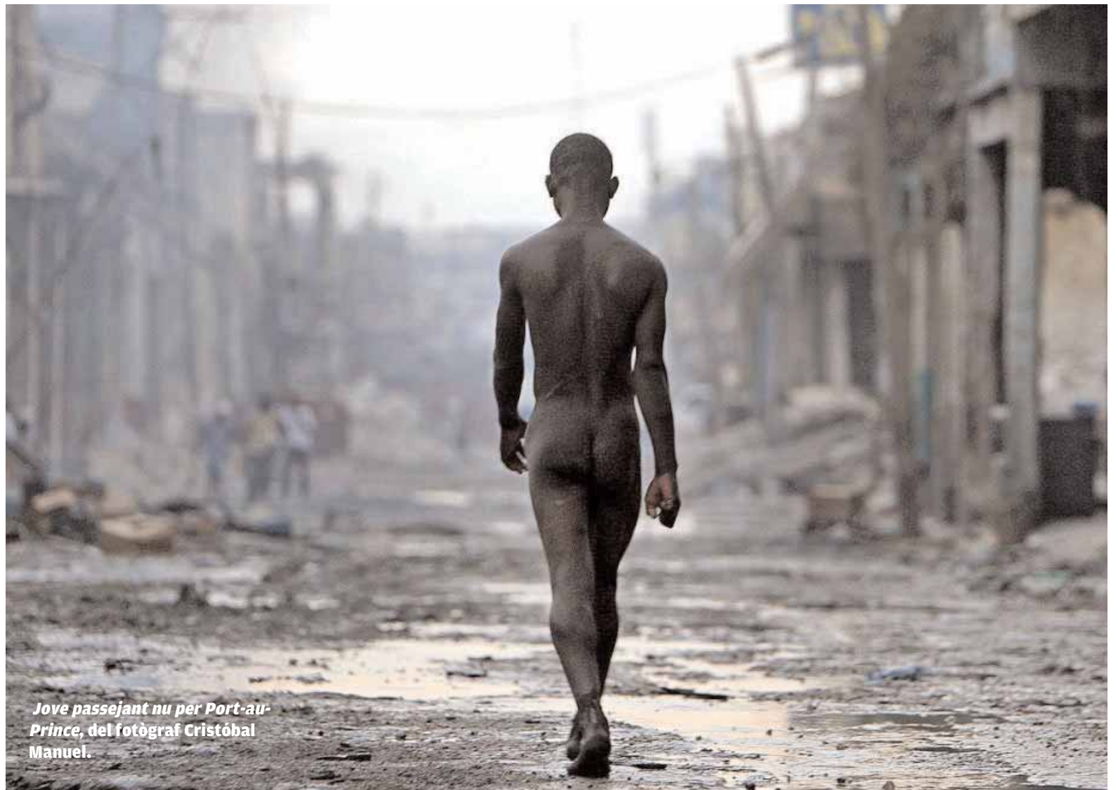
Jove passejant nu per Port-au-Prince