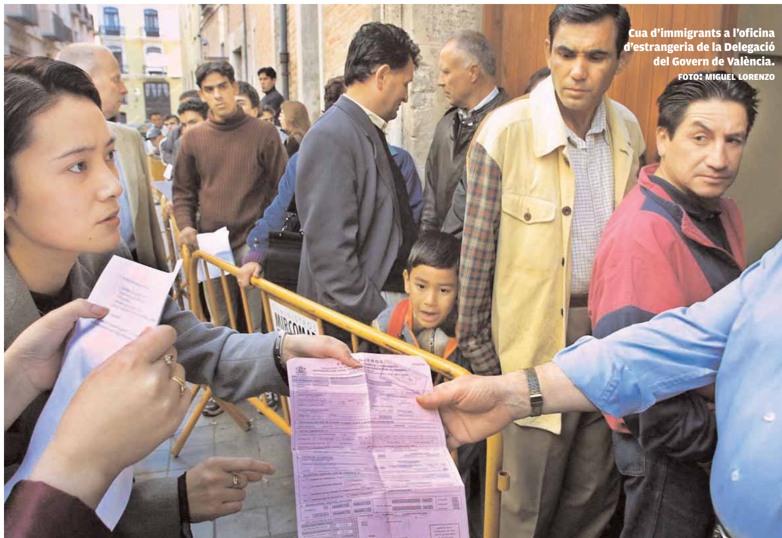
Cua d'immigrants a l'oficina d'estrangeria de la Delegació del Govern de València.

La qüestió, per a Javier de Lucas, no és només eixamplar la noció de ciutadania als emigrants, sinó trencar els límits que ens posa a tots perquè "ens mostren les fronteres internes de la democràcia", on, com s'ha vist amb la crisi econòmica, no decideixen els ciutadans ni els governs, sinó els mercats. La lògica de la globalització és un món sense regles, en el qual se li ha fet una volta a la llustració, de manera que la ciutadania no és un títol d'alliberament, sinó de subjecció a l'Estat. De Lu-