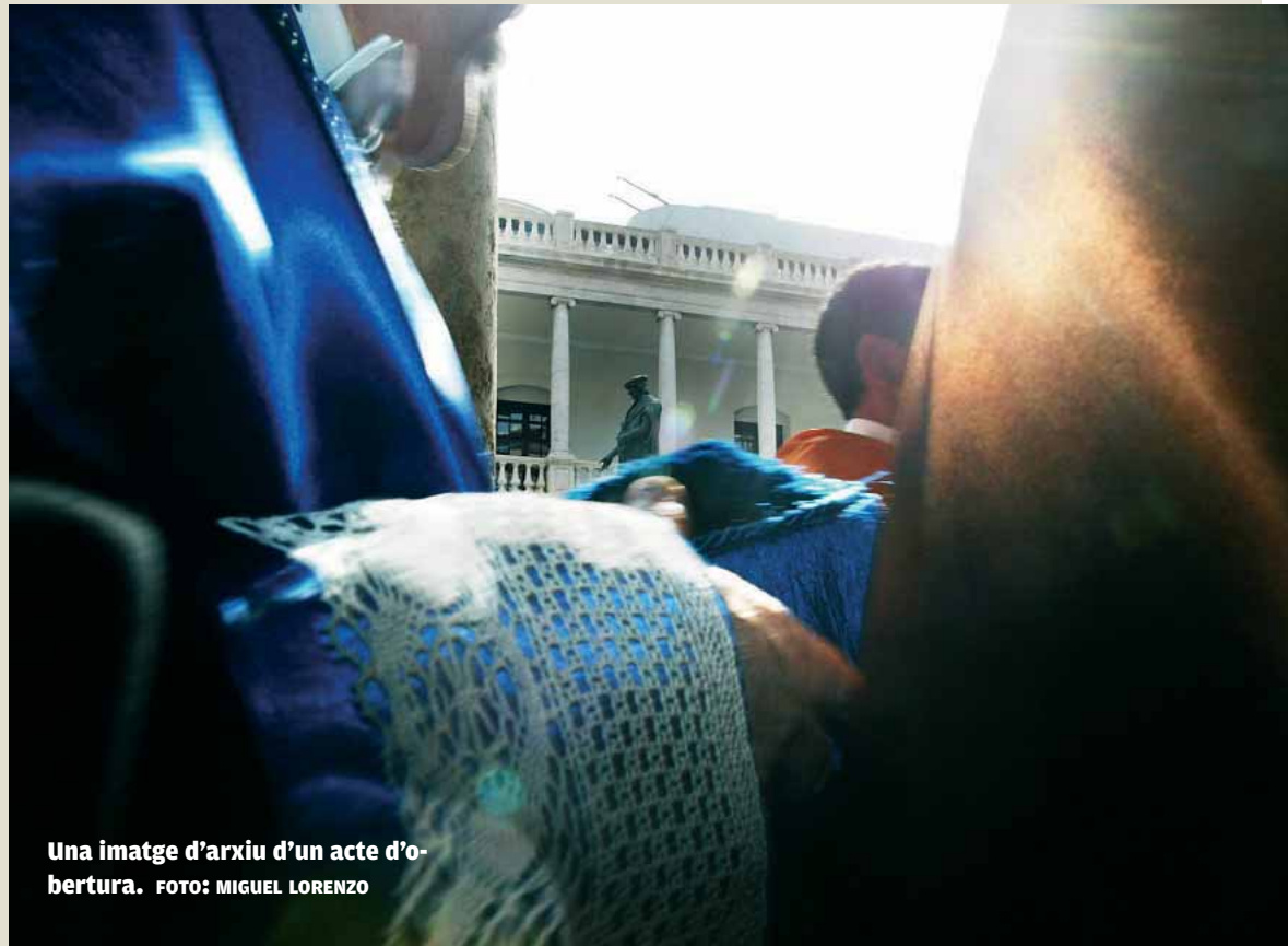
Una imatge d'arxiu d'un acte d'obertura.