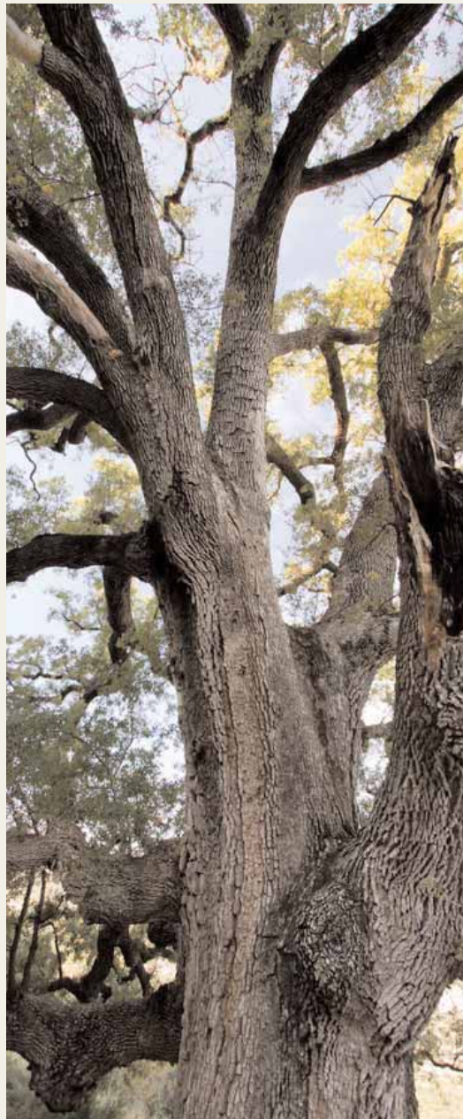
Barranc dels Horts (L'Alt Maestrat).

Les eixides estan previstes per als dies 5, 12, 19 i 26 de novembre i l'horari serà de 9 a 14 hores la classe teòrica del primer dia i de 8:30 a 19 hores les eixides de camp. El curs costa cent euros, amb els quals s'inclou el desplaçament en autobús per a les eixides. Més informació en la web www.jardibotanic.org .