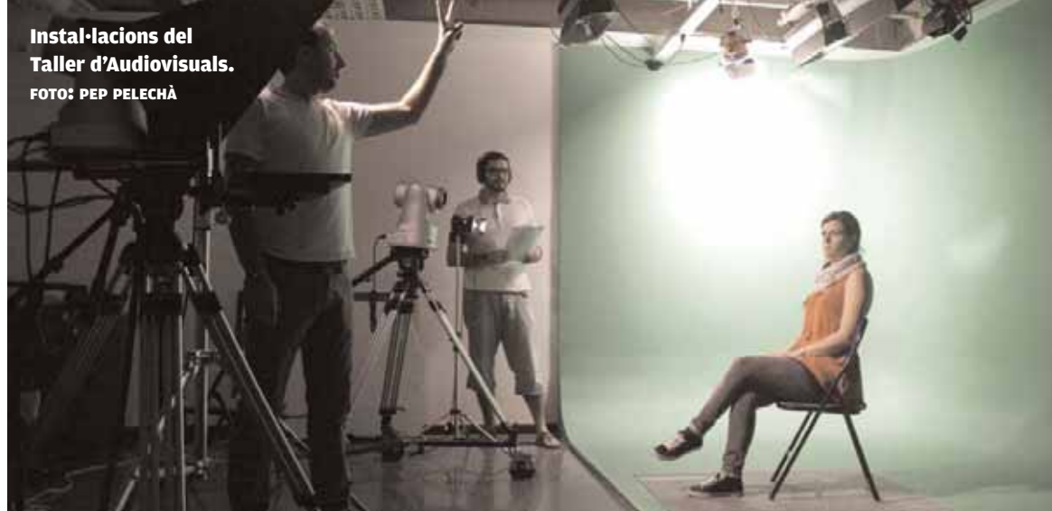
Instal·lacions del Taller d'Audiovisuals.

El director de l'IRTIC, Marcos Fernández, considera que amb el Centre Integrat de Producció i Formació en Entorns Multimèdia 3D, la Universitat de València "aconsegueix integrar la potencialitat de desenvolupament de continguts digitals existent en aquesta institució acadèmica, que té una tradició important. D'una banda, des del punt de vista tecnològic a través de l'IRTIC i, per una altra, de la mà del TAU amb una dilatada experiència en l'elaboració de continguts digitals culturals i divulgatius de gran qualitat".