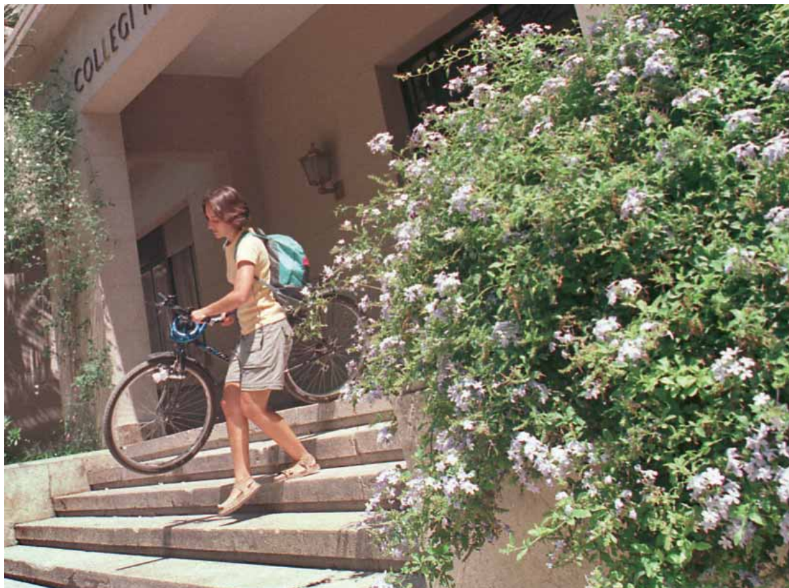
Una estudianta, amb la seua bicicleta al Col·legi Major Lluís Vives.

La Universitat de València s'ha fixat com un objectiu prioritari per al 2015 aconseguir un campus sostenible i saludable, amb pràctiques de comerç just. El Consell de Govern va aprovar aquest dimarts el projecte Campus Sostenible, l'estratègia institucional que pretén una política pròpia i una gestió coordinada per a contribuir a la sostenibilitat des de tots els àmbits universitaris.