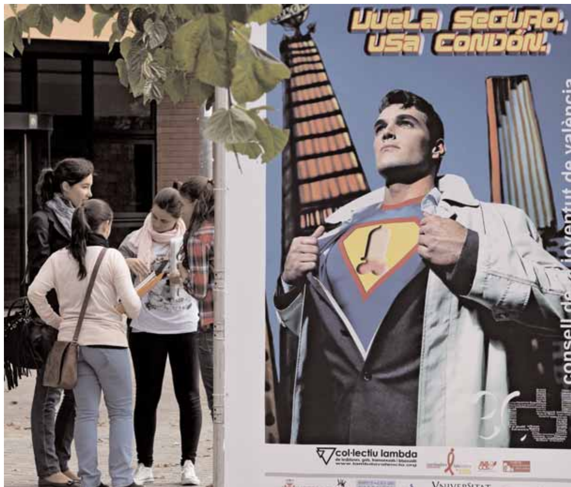
Un cartell d'una de les associacions presents a la Fira en què s'ha tractat el tema de la sida.