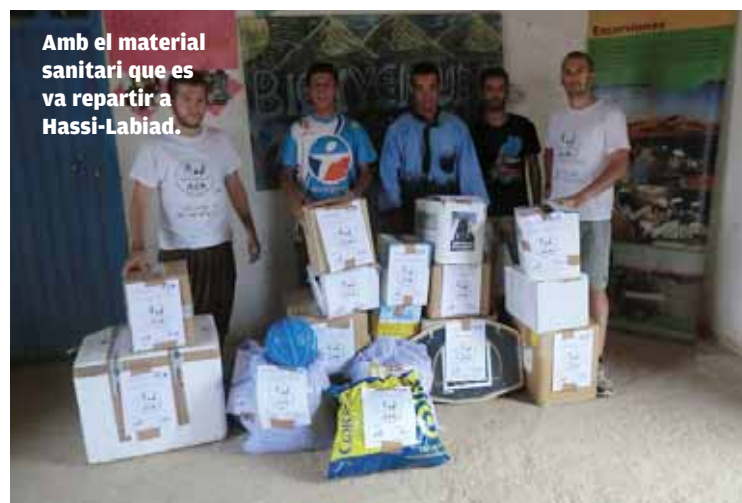
Amb el material sanitari que es va repartir a Hassi-Labiad.

■ "Fórem capaços de donar atenció personalitzada a unes huitanta o noranta persones al dia i la gent estava contenta i volia participar"