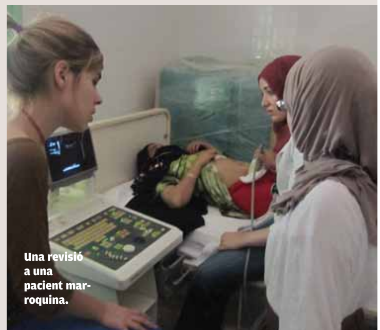
Una revisió a una pacient marroquina.