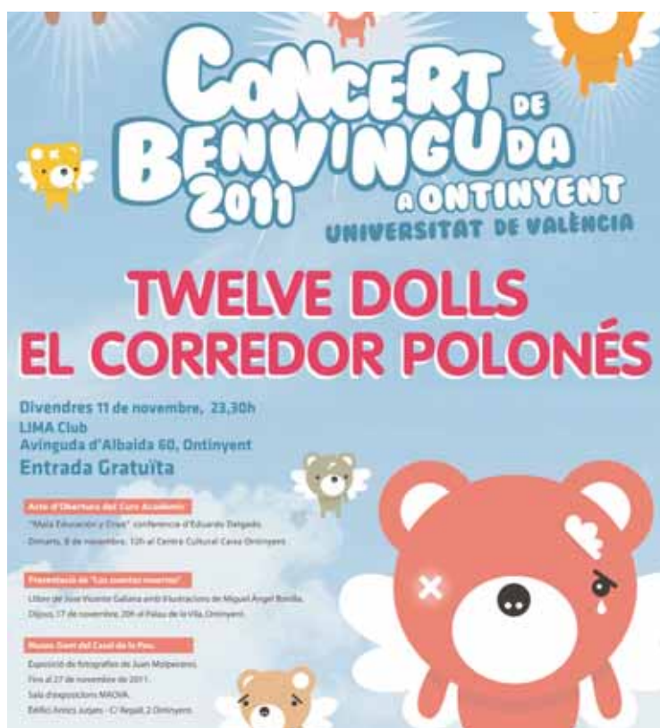
Cartell de la Benvinguda amb la programació d'Ontinyent.

La programació es pot consultar en el blog creat per la Delegació d'Estudiants (que organitza la Setmana de Benvinguda): http://benvinguda.blogs.uv.es .