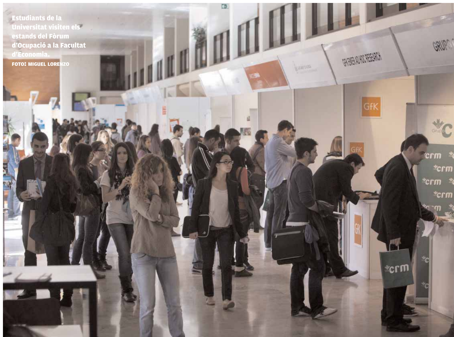
Estudiants de la Universitat visiten els estands del Fòrum d'Ocupació a la Facultat d'Economia.