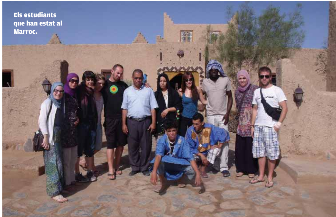
Els estudiants que han estat al Marroc.