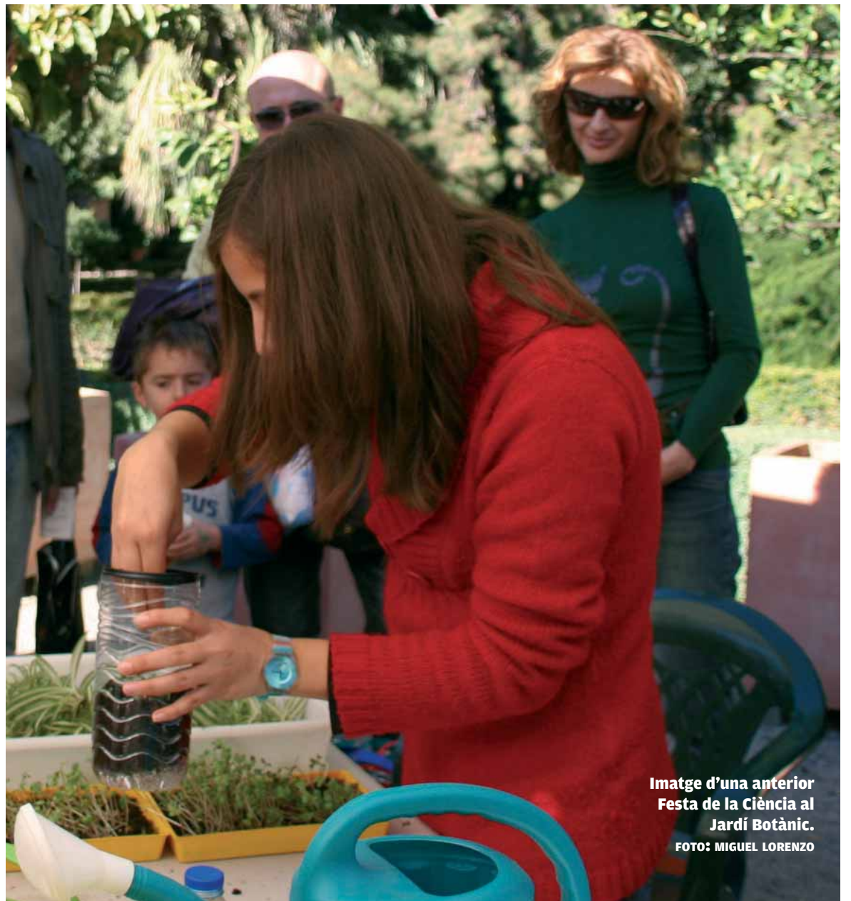
Imatge d'una anterior Festa de la Ciència al Jardí Botànic.

La Setmana de la Ciència i la Tecnologia de la Universitat de València promou altres activitats dirigides a diversos tipus d'audiències. Per exemple, per al públic en general, s'han previst conferències, tant en la Setmana de la Ciència de l'Ajuntament d'Algemesí, que comença hui, com en el cicle de ponències inclòs en els Premis Literaris Ciutat d'Alzira. En el context d'aquests, la Universitat de València concedirà aquest divendres el XVII Premi Europeu de Divulgació Científica Estudi General, finançat per Bancaixa amb 18.000 euros. La Càtedra també organitza aquest mes Bars de Ciència a l'Espai