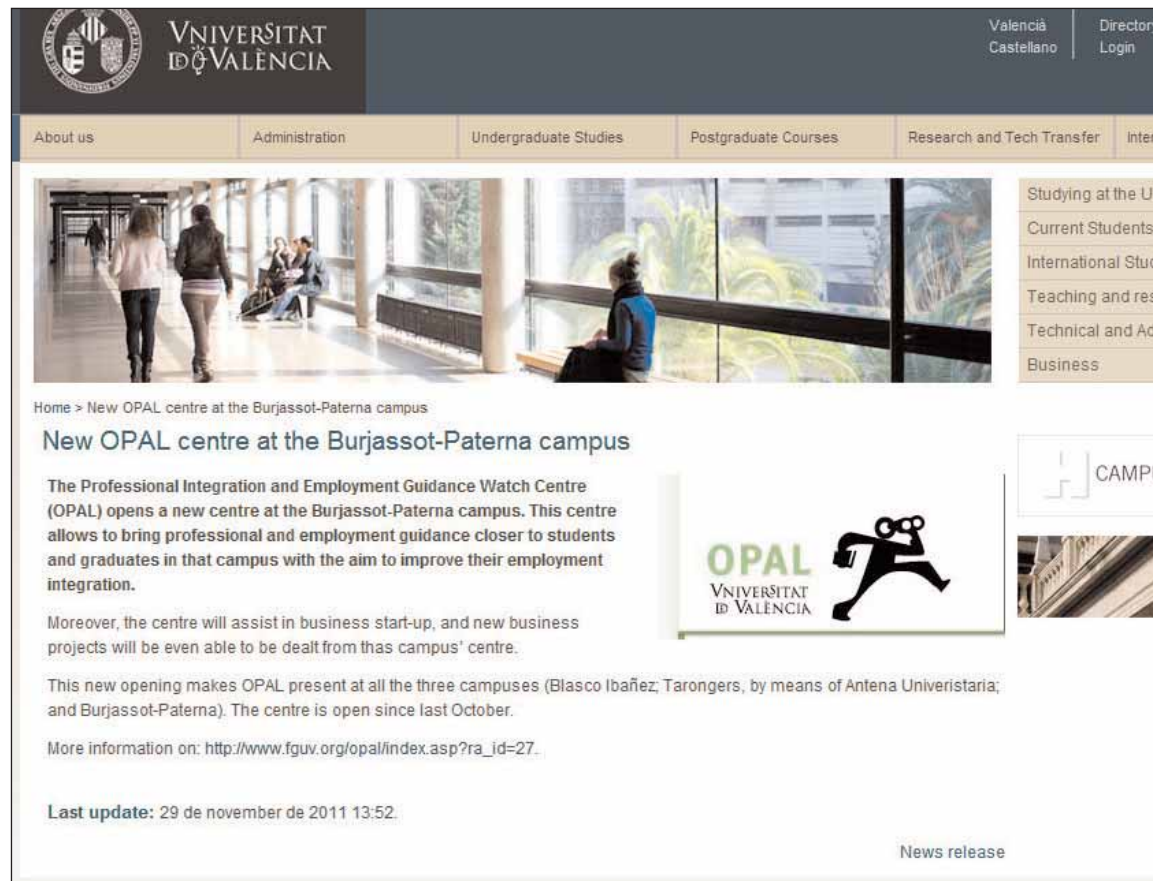
Una de les notícies de la web de la Universitat, en la seua versió anglesa.

La nova pàgina web, impulsada des del Vicerectorat de Comunicació i Relacions Institucionals, no es limita a un canvi de disseny, sinó que incorpora una nova filosofia de gestió de continguts, on tots els membres de la comunitat universitària (professors, estudiants i personal d'administració i serveis) participen amb les seues aportacions.