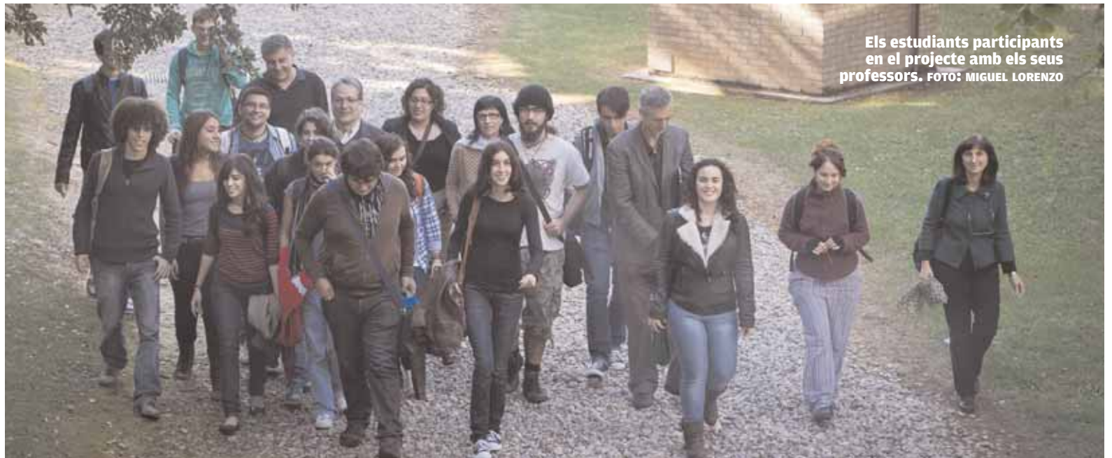
Els estudiants participants en el projecte amb els seus professors.

Els temes tracten sobre la biologia general i el professorat ha tractat d'adaptar-los a una biologia centrada en la biodiversitat, més ecològica o fins i tot mol·lecular. "Després vam demanar als estudiants que participaren voluntàriament per tal de testar el