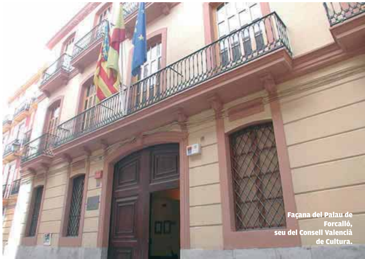
Façana del Palau de Forcalló, seu del Consell Valencià de Cultura.

Les universitats públiques valencianes han fet un extraordinari esforç en