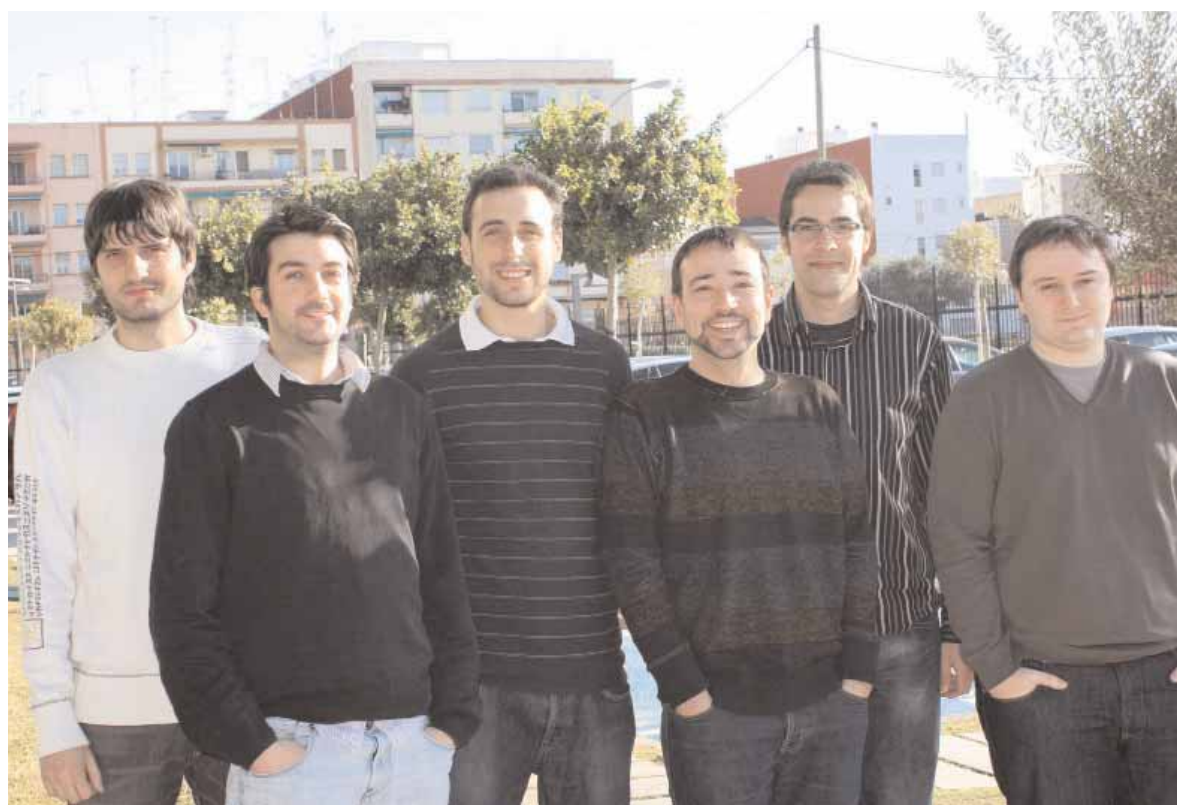
Alguns dels membres de l'empresa Nubesis, que ha desenvolupat el projecte.

L'adopció d'aquest sistema d'agenda on-line té com a precedent el Consolat General de Colòmbia a Madrid,