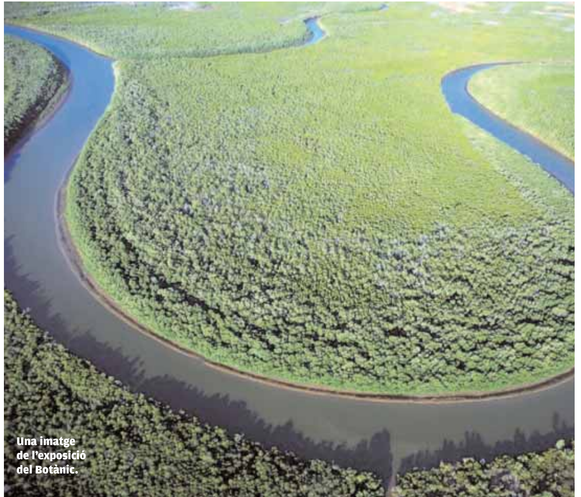
Una imatge de l'exposició del Botànic.

de la població malgache, i que han portat la Fundació Agua de Coco a impulsar diversos projectes humanitaris per a canviar aquesta situació mitjançant l'educació com a motor de desenvolupament.