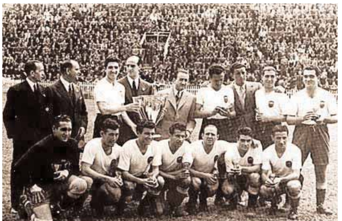
L'equip del València CF que va guanyar el seu primer Campionat de Lliga, l'any 1942.

Durant 30 hores (en deu sessions vespertines de tres hores), es repassarà la història del València CF des d'un punt de vista cronològic i s'anallitzarà el club en el context de la societat valenciana i del panorama fut-