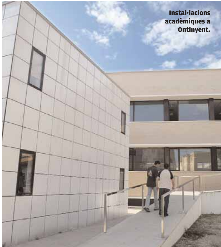
Instal·lacions acadèmiques a Ontinyent.

El sopar anual tingué lloc al restaurant Font Jordana d'Agullent i el premi consisteix en una escultura de l'artista albaidí Josep Sanjuan. La trobada va ser un reflex de les receptes de la secció gastronòmica del Calendari de Festes, Tradicions i Gastronomia de l'IEVA, dedicat l'any 2012 a la cuina francesa, de manera que el menú tenia profundes ressonàncies gal·les. La vetllada va servir també per a presentar el nou llibre de l'associació: Enric Valor: lingüista, novel·lista i rondaller , un volum que recull la jornada dedicada a l'es-