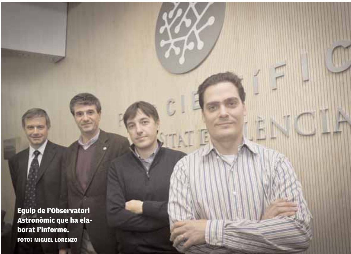
Equip de l'Observatori Astronòmic que ha elaborat l'informe.

INVESTIGACIÓ. S'han utilitzat tècniques pròpies de fotografia astronòmica