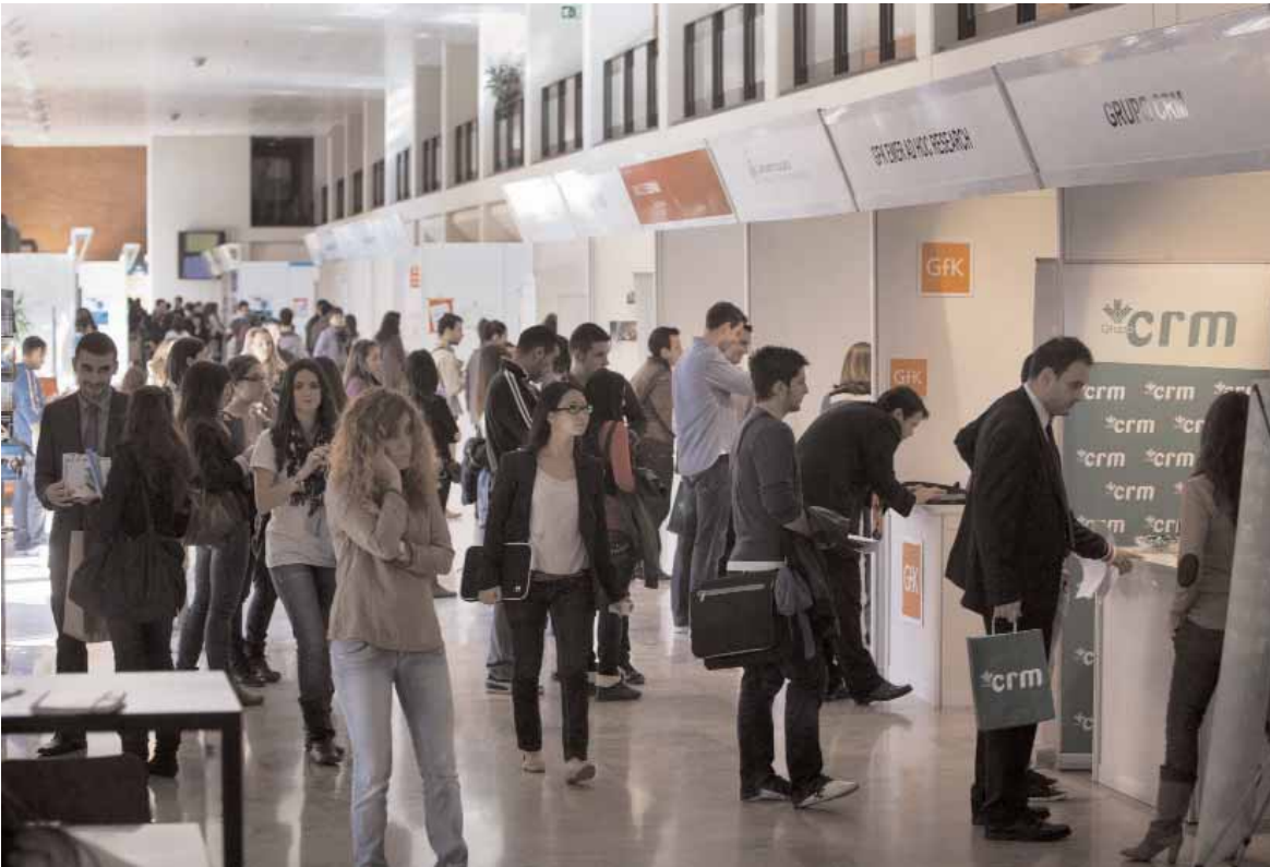
Uns estudiants durant la Fira d'Ocupació celebrada l'any passat.

L'estudi s'ha publicat en The Spanish Journal of Psychology