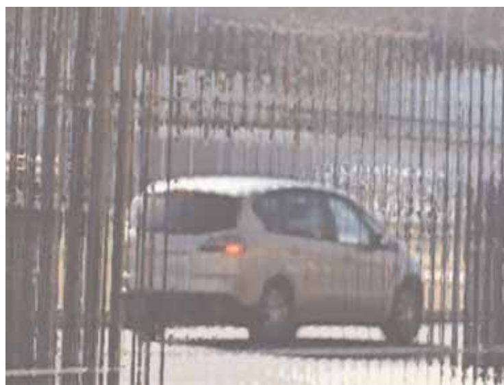
Imatges similars a les utilitzades en l'informe, que il·lustren sobre les tècniques de vídeo emprades.