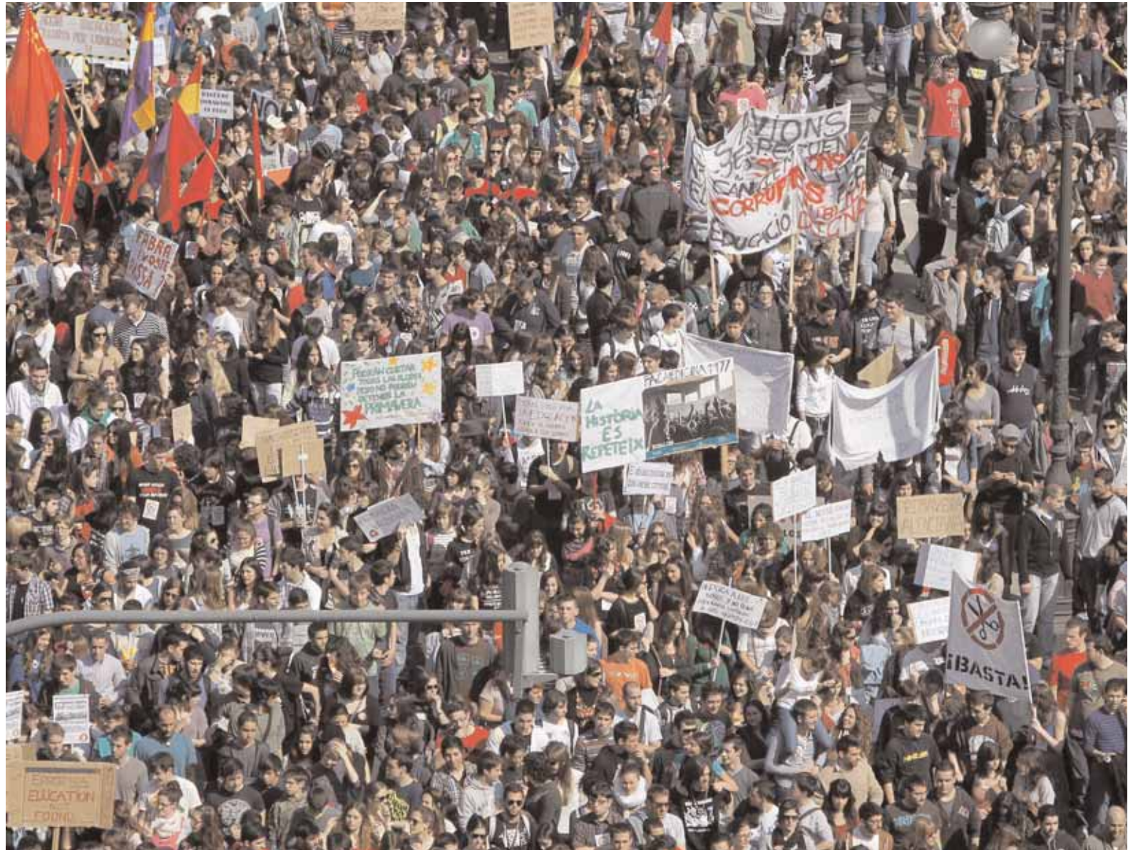
Aspecte de la manifestació dels estudiants celebrada ahir.

D'altra banda, l'equip rectoral ha recordat als estudiants concentrats