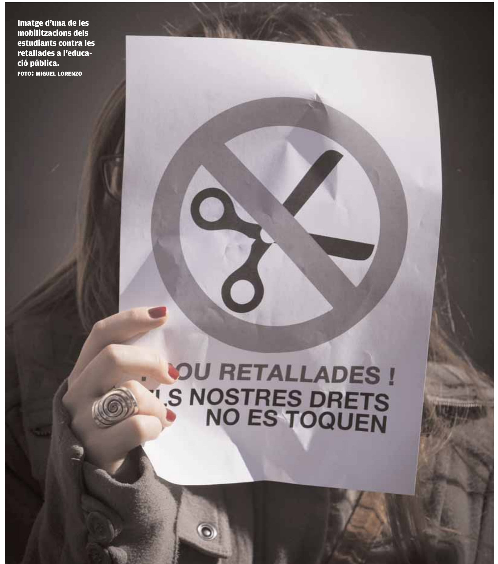
Imatge d'una de les mobilitzacions dels estudiants contra les retallades a l'educació pública.

En el seu informe davant del darrer Consell de Govern, celebrat dijous 26 d'abril, el rector, Esteban Morcillo, va expressar la seua preocupació pel decret del Govern central sobre la reorganització del sistema universitari. El rector va detallar les accions que s'han realitzat els últims dies per a conèixer opinions i adoptar mesures conjuntes. Esteban Morcillo féu referència al comunicat que ha difós la CRUE -publicat en la web de la Universitat- i va anunciar un document conjunt dels rectors de