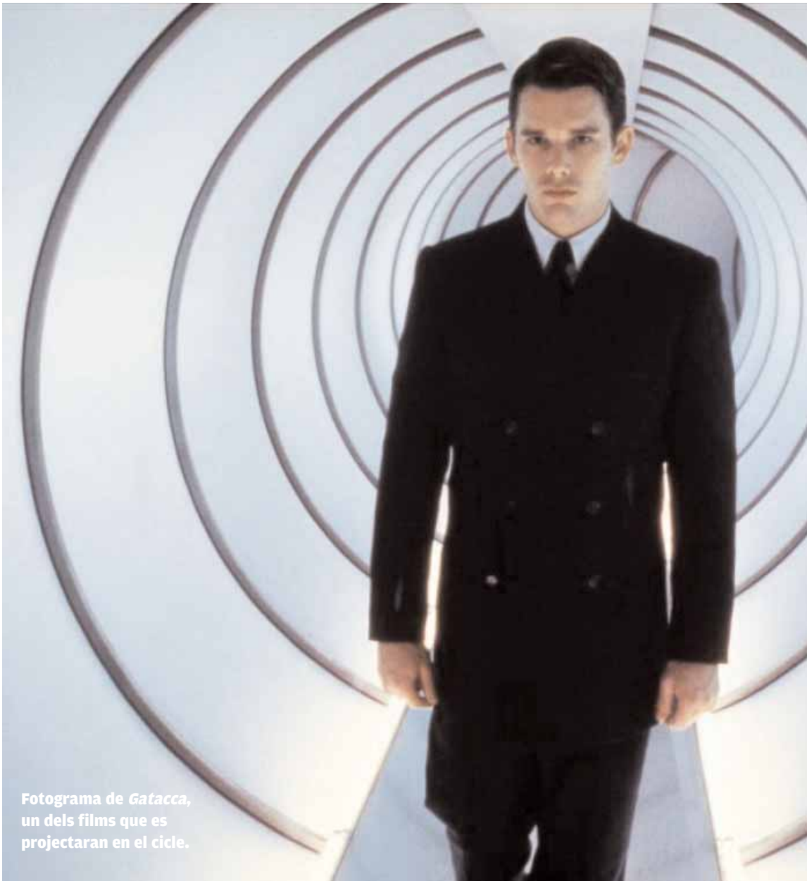
Fotograma de Gatacca , un dels films que es projectaran en el cicle.