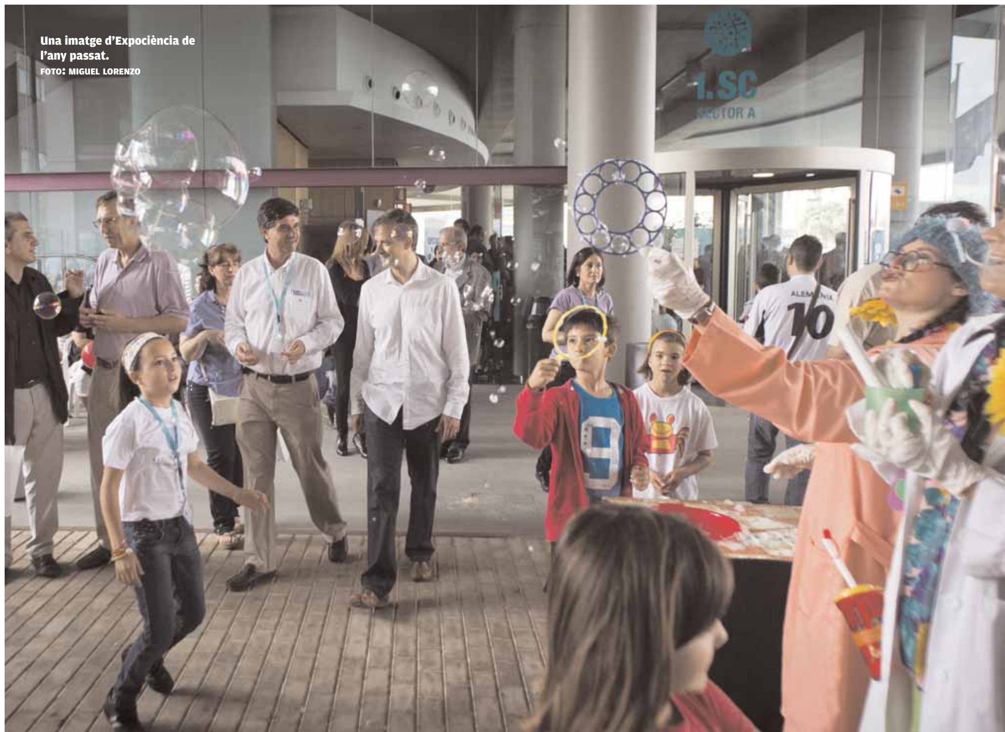
Una imatge d'Expociència de l'any passat.

Aquest divendres, 18 de maig, s'obri el termini per a matricular-se en la Universitat d'Estiu, la quinzena més intensa de la programació del Centre Internacional de Gandia (CIG). El cinema i el coneixement protagonitzen els cursos que ofereix el programa. Amb aquesta edició, el CIG inicia una nova etapa, de la mà del nou director, Josep Montesinos. Pàgs. 5/6/7/8