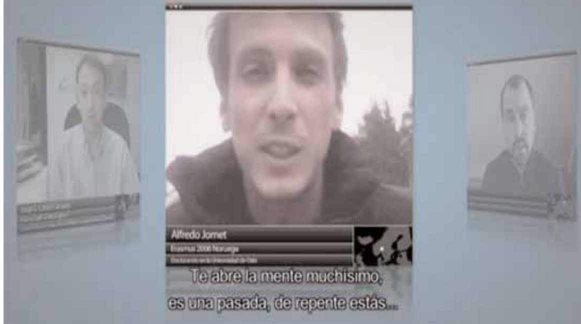
Una imatge de l'exposició de la Nau.