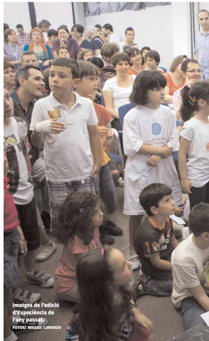
Imatges de l'edició d'Expociència de l'any passat.

implicar els visitants, a manera de joc, en la realització d'interessants experiments, com ara fabricar molècules o neu artificial, tastar la física de les gominoles, canviar el color de les monedes d'euro o observar la radioactivitat natural en directe. Es contactarà amb el Pol Sud mitjançant videoconferència, es podrà jugar en tres dimensions, fer una passejada aèria per la Comunitat Valenciana amb el simulador d'ala delta, o realitzar observacions a través dels telescopis de neutrins i els telescopis espacials que Expociència posa-