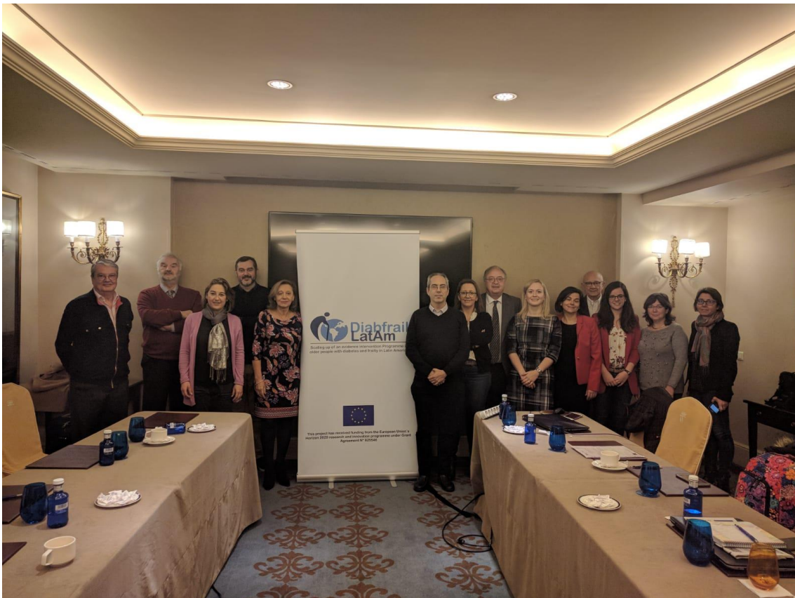
Grupo de representantes del proyecto Diabfrail LatAm

México y Brasil están entre los cinco primeros países a nivel mundial con mayor número de personas con diabetes, afectando la enfermedad a un 12% de la población, aproximadamente.