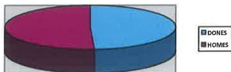
PERCENTATGES DEL GRUP C, SUBGRUP C1, ADMINISTRACIÓ ESPECIAL

En canvi, pel que fa al personal funcionari de l'escala tècnica bàsica d'arxius i biblioteques, es mostra un desequilibri major, mostrant una plantilla més feminitzada.