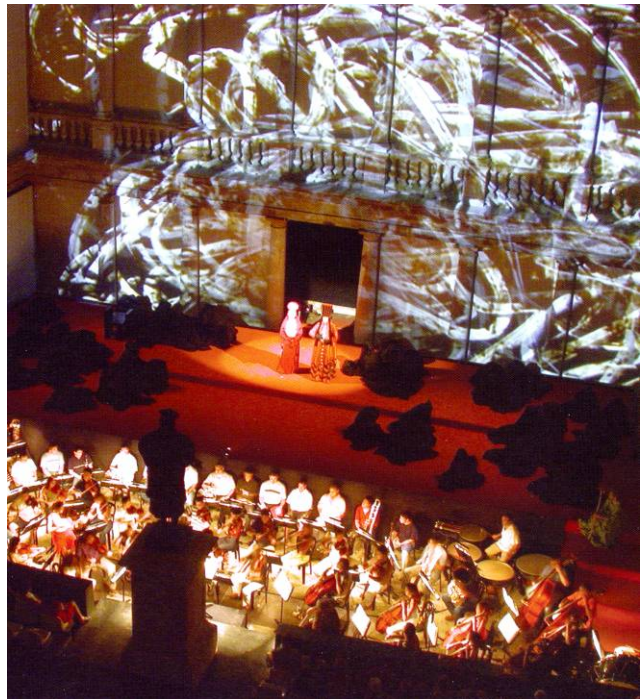
Representació d' Edipo Rey

veniments internacionals, els cursos especialitzats, els seminaris i congressos científics, i la resta d'activitats que configuren, juntament amb les seues col·leccions patrimonials i espais d'àmbit museístic, una molt àmplia i diversificada oferta de possibilitats al servei d'un ambiciós projecte cultural, que dota de sentit a l'emblemàtic edifici universitari i complementa els atractius culturals de València, des dels plantejaments de reflexió, diàleg i servei que caracteritzen aquesta institució acadèmica des de la seua fundació, ja fa més de mig mil·lenni.