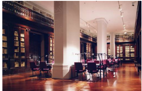
Sala Pérez Bayer

Entre els seus fons més estimables es troba la col·lecció de còdexs i manuscrits, en gran part procedents de la Biblioteca Reial de Nàpols, traslladats al monestir valencià de Sant Miquel dels Reis per Ferran d'Aragó, duc de Calàbria.