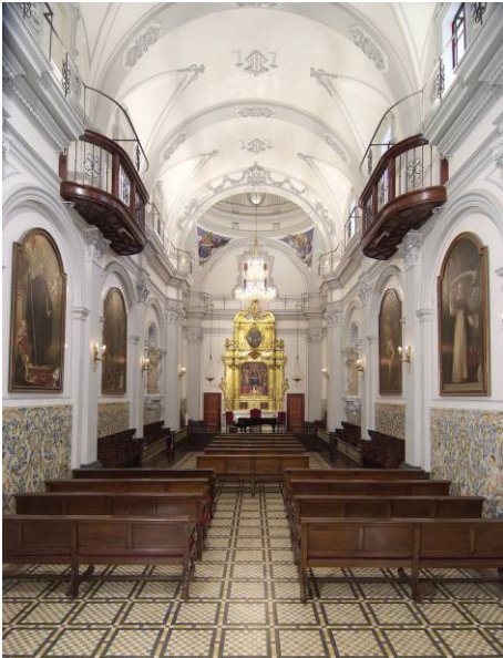
Capella de la Sapiència

La capella universitària va ser construïda l'any 1498 pel cèlebre arquitecte del període gòtic valencià Pere Compte i va ser totalment renovada el 1736 per Miquel Martínez en una variant classicista del barroc meridional.