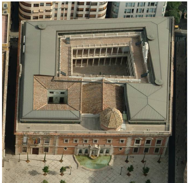
Universitat de València. Estudi General

Actualment, l'activitat acadèmica de la Universitat es desenvolupa a les facultats i escoles repartides als seus tres campus, i també als diversos instituts d'investigació distribuïts per tota la ciutat de València. A l'edifici històric hi ha la Biblioteca Històrica, les dependències rectorals i diversos serveis de caràcter administratiu, burocràtic i cultural.