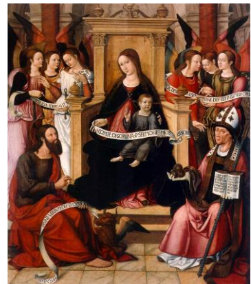
Virgen de la Sapiència by Nicolás Falcó, 1516

Des de la seua fundació, la Capella ha estat la gran sala d'actes de la Universitat, on a més dels serveis religiosos, hi tenien lloc les oposicions a les càtedres, la defensa de les tesis, la concessió dels graus acadèmics i, especialment, les sabatines , discussions escolàstiques entre professors i estudiants que podien ser presenciades per qualsevol ciutadà.