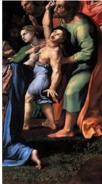
[Fig. 20, detalle]