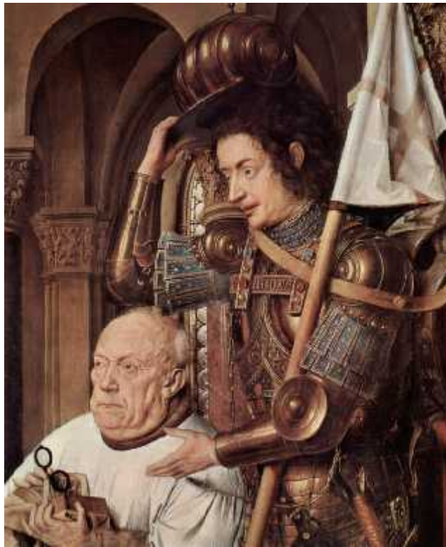
[Fig. 15 Detalle]

Por último, y procedente de un manuscrito de finales del siglo XV de la Biblioteca Nacional de Paris es este “Parto” [Fig. 16] que muestra con insólita crudeza y realismo una operación cesárea.