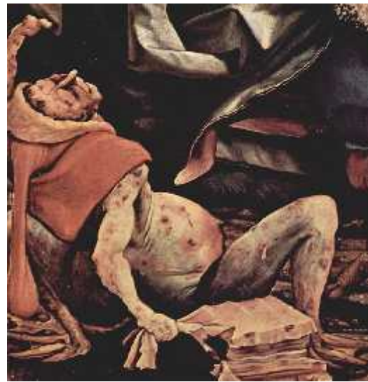
[Fig. 27, detalle]