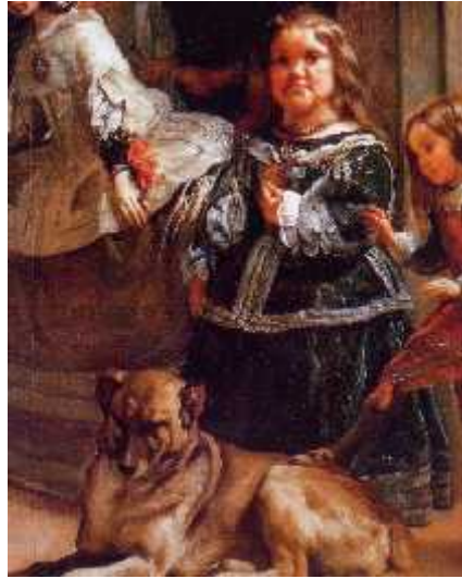
[Fig. 36. Detalle]

Aquí, en el Museo de Bellas Artes San Pío V de Valencia tenemos, atribuido a Velázquez , un “ San Simón de Rojas ” [fig.37], con una lesión cutánea frontal que sabemos tenía al nacer (“una coza de diablo” decían sus contemporáneos que era ello) y que bien podría tratarse de un angioma plano.