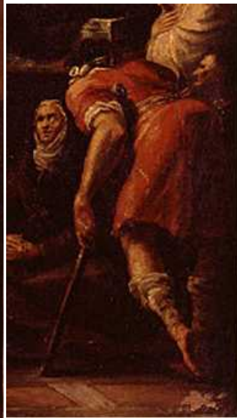
[Fig. 45, detalle]