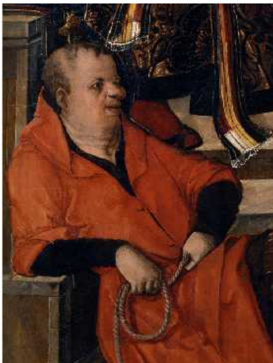
[Fig. 19. Detalle]