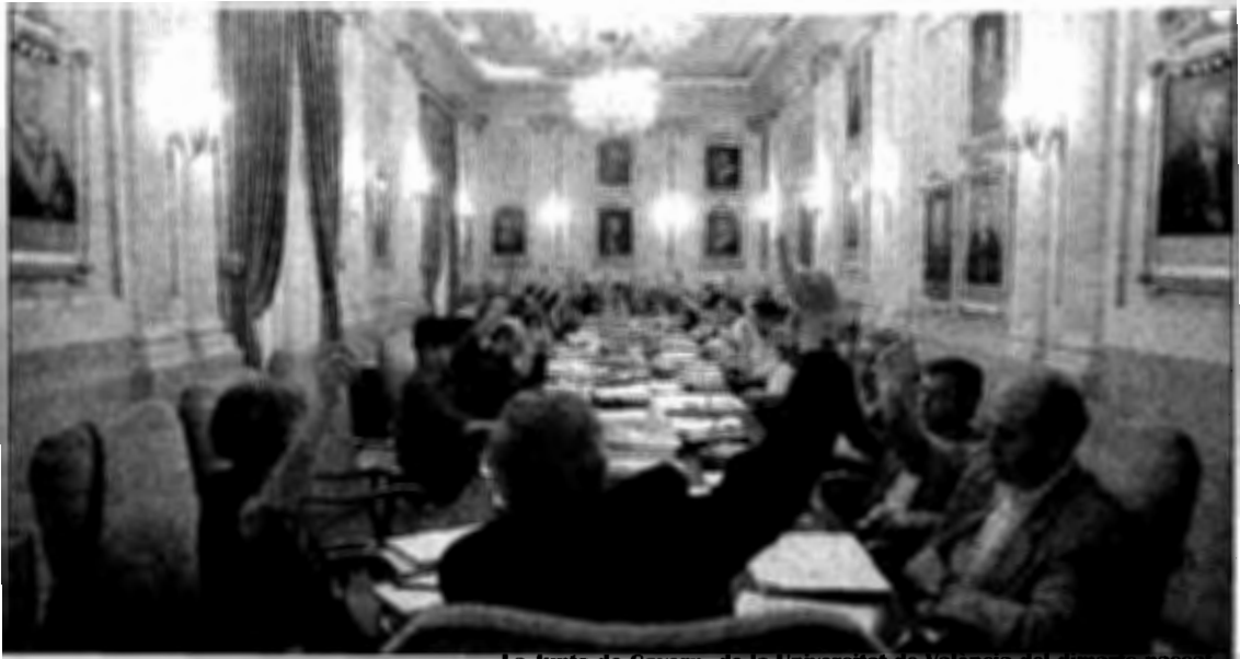
La Junta de Govern de la Universitat de València del dimarts passat.

El neurocirurgià i catedràtic d'Anatomia va ser rector