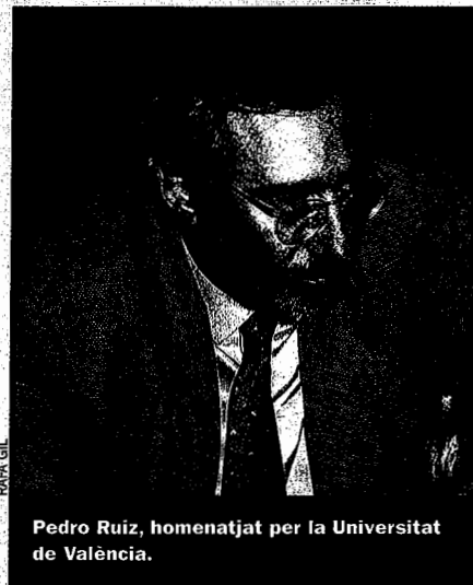
Pedro Ruiz, homenatjat per la Universitat de València.

Pedro Ruiz Torres, rector entre juny del 1994 i març del 2002 de la Universitat de València, va rebre el 16 de desembre la medalla d'aquesta universitat en el transcurs d'un acte solemne en què Ruiz va criticar "l'apropiació totalitària de la democràcia" que marca en moltes ocasions la política actual. La gestió de Ruiz es va emmarcar en el moment d'un canvi transcendent: dels anys de la massificació, es va anar passant a una davallada d'estudiants molt significativa. I tot això enmig de la voluntat clara que la Universitat de València és mantenir com a referent de la identitat valenciana, en un moment polític totalment contrari.