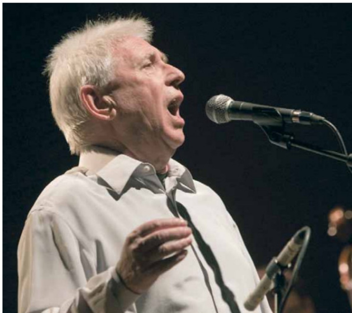
Raimon durant un concert a la ciutat de València.

D'altra banda, el Consell de Govern va aprovar els nous plans d'estudi adaptats a l'Espai Europeu d'Ensenyament Superior (EEES) del Grau de Dret i del Grau de Ciències Polítiques