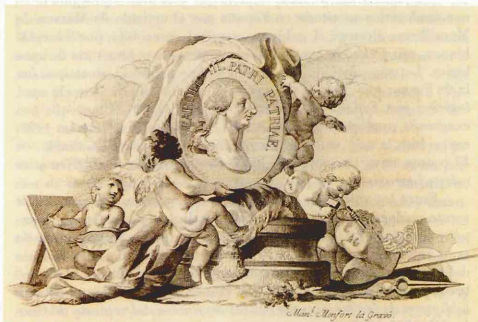
Retrato alegórico de Carlos III. Siglo XVIII. Imp. Monfort. Algunas de las obras de Cavanilles respondían al programa de “apologías” que sobre España se elaboraron durante el reinado de Carlos III.