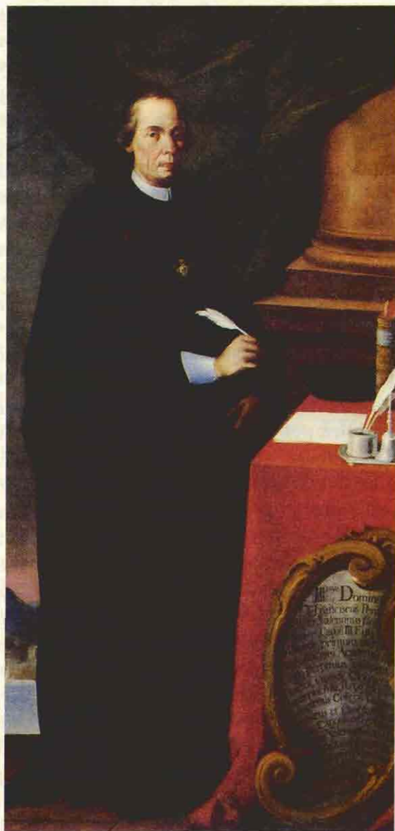
Retrato de Francisco Pérez Bayer. Teatro del Estudi General. El “todopoderoso” Pérez Bayer capitaneó el grupo de intelectuales valencianos, llamado “turianos”, en la corte de Carlos III, entre los que se encontraba Cavanilles.