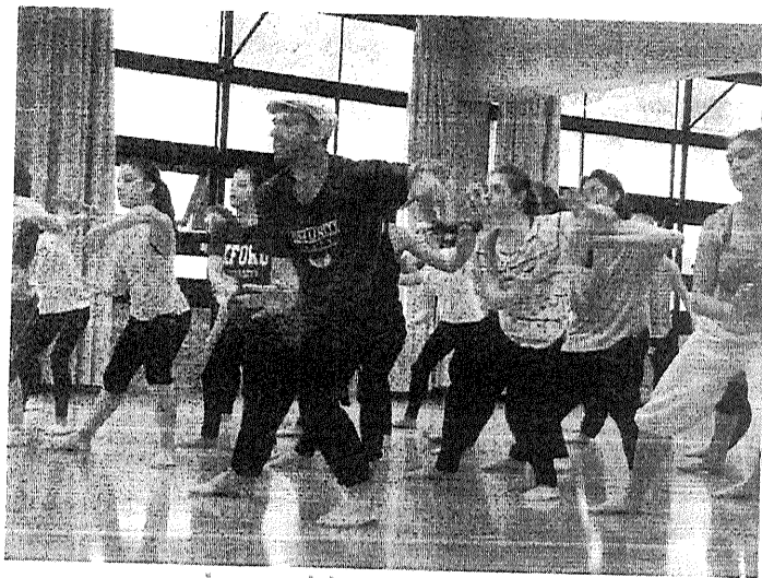
Imagen del curso

Presupuesto: 1.600€ (publicidad, dietas y viajes de profesorado.)