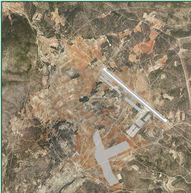
PROYECTO DEL AERÓDROMO DE ALCUBLAS

El aeródromo deportivo de Alcablas, en cuya planificación ha primado el respeto por el medio ambiente, vendrá a paliar el vacío que actualmente sufre el deporte aéreo en Valencia, pero servirá también para mostrar la voluntad de unas gentes empeñadas en hacer que su tierra, hoy herida, pueda ofrecer las condiciones necesarias para vivir con dignidad. Estas son las tres realidades recogidas en el título “Desarrollo rural, naturaleza y deporte” que preside esta jornada de encuentro organizada por el Ayuntamiento de Alcablas y el Vicerrectorado de Participación y Proyección Territorial de la Universitat de València.