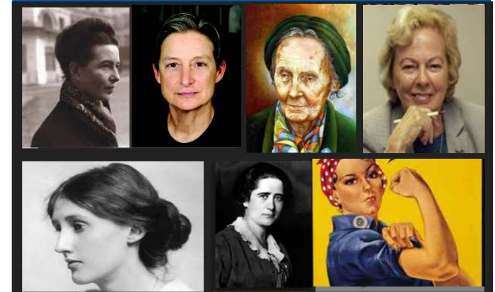
Simone de Beauvoir, Judith Butler, Alicia Moreau de Justo, Nell Noddings, Virginia Wolf, Clara Campoamor.

La igualdad también se aprende: Pensar y educar desde la perspectiva de género