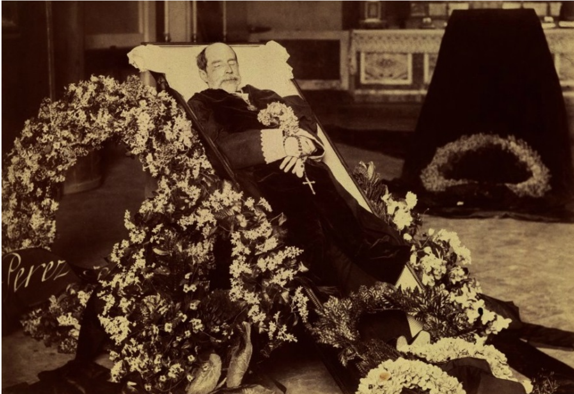
[Il·lustració 1. Fèretre amb les despulles d'Eduardo Pérez Pujol, 1894.]

matèria, amb nomenament de 1884 (Blasco 1996). Els darrers anys de la seua vida es dedicà al estudi de les formes jurídiques, socials i, fins i tot, artístiques del període visigòtic, el que va donar lloc a la seua obra en quatre volums Historia de las instituciones sociales de la España goda , publicada el 1896, dos anys després de la seua mort.