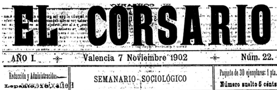
[Il·lustració 5. Capçalera d'El Corsario. Semanario Sociológico. Font: