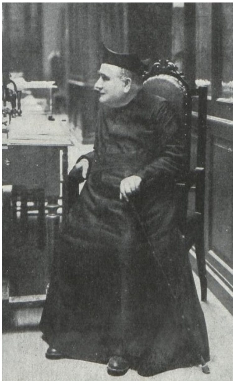
[Il·lustració 4. Retrat del P. Vicent, “La Hormiga de oro”, 15/6/1912, p. 7.]

Antonio Vicent Dolz (1837-1912) estudià batxillerat a Castelló i Filosofia i Dret a la Universitat Complutense. En acabar aquest estudis ingressà a la Companyia de Jesús. Després estudià ciències (biologia) a la Universitat de Sevilla i va fundar el primer Cercle Catòlic a Manresa (1865) (altres fonts parlen d'Alcoi). En l'època de la Revolució de 1868, marxà a l'exili. En 1883 tornà i fou destinat a València, on continuà fundant cercles, cooperatives i patronats educatius. Així, va fundar la Casa dels Obrers