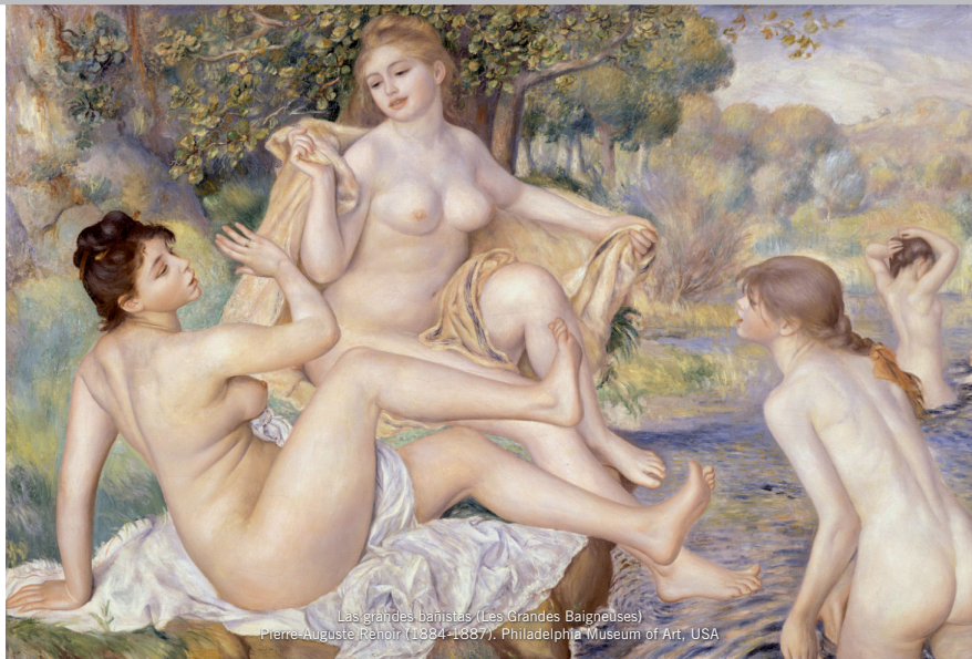
Las grandes bañistas (Les Grandes Baigneuses) Pierre-Auguste Renoir (1884-1887). Philadelphia Museum of Art, USA