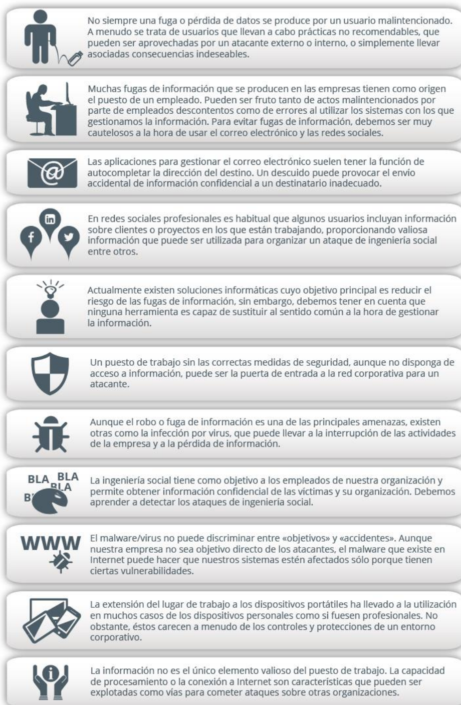
Ilustración 1: Escenarios de riesgo

Cuando hablamos de escenarios de riesgo en el puesto de trabajo podemos encontrarnos con situaciones como las siguientes: