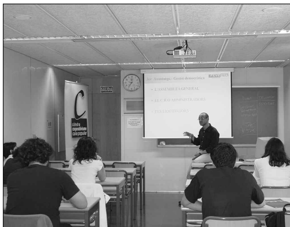
Izquierda: FEVECTA y Caixa Popular firman un convenio para favorecer el acceso a financiación de las cooperativas asociadas. Derecha: FEVECTA colabora con la Cátedra Caixa Popular, de la Universidad Politécnica de Valencia, para divulgar la forma cooperativa entre los universitarios.

gencias que la crisis económica y financiera mundial ha impuesto. De ahí el lema del Congreso, titulado “Nuevos tiempos, nuevas estrategias”.