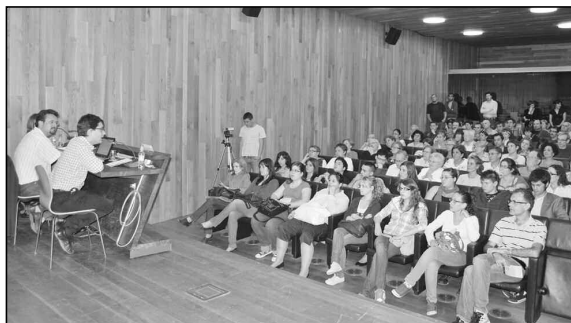
Presentación del proyecto Fiare en Castelló.