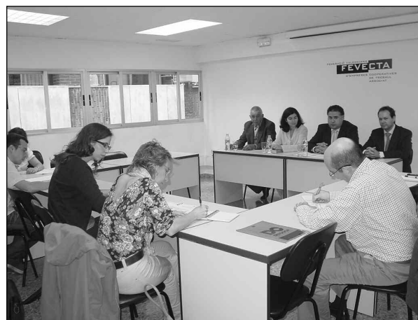
Izquierda: Charla sobre cooperativismo para los profesores de ciclos formativos. Derecha: Descoop, integrada por FEVECTA, Caixa Popular y las Cajas Rurales La Vall y Almassora, informa en rueda de prensa sobre las primeras ayudas destinadas a cooperativas.