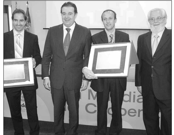
Las cooperativas Ruchey y Cartonajes Aitana fueron las homenajeadas en la edición de 2008 del Día Mundial del Cooperativismo en la Comunidad Valenciana. El conseller Gerardo Camps otorgó los cuadros conmemorativos.

La Confederación de Cooperativas valoró el esfuerzo de La Viña por mantener una continua innovación y, especialmente, resaltó su firme apuesta por la integración cooperativa, comercializando toda su producción a través de la cooperativa de 2º grado Anecoop.