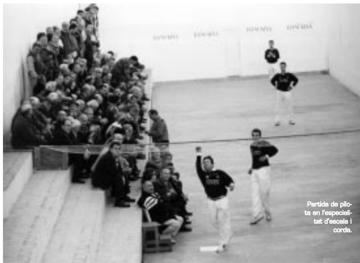
Partida de pilota en l'especialitat d'escala i corda.

REGLES DEL JOC. La ferida es realitza des d'una pedra col·locada a un metre davant de la corda dins del camp del dau (en el dibuix pedra de ferir). El feridor bota la pilota i, jugant-la amb el palmell de la mà, la impulsa contra la muralla de l'escala (la paret de la dreta), des d'on, obligatòriament, ha de colpejar-la per dalt d'una línia (en el dibuix línia de ferir) per tal