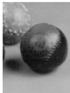
Pilotes de badana.

Foren usades tradicionalment al joc de carrer en tindre un preu més econòmic, i actualment són les indicades per a l'entrenament i la competició dels alevins, com també en la formació inicial