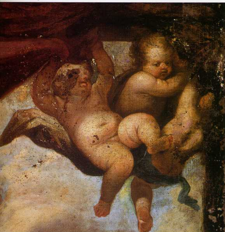
Fig.13. Detalle de un grupo de ángeles de La milagrosa labra de la Virgen de los Desamparados .