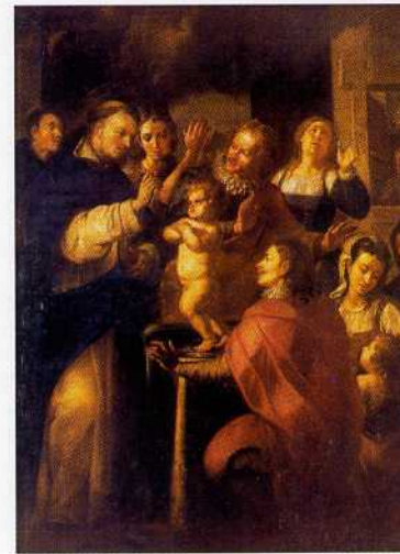
Fig. 17. El Milagro del niño de Morella . Gaspar de la Huerta. Museo de Bellas Artes de Valencia.

No cabe duda que el lienzo que hemos titulado ya como Privilegio Real de Alfonso el Magnánimo , adelantando con ello su iconografía, es de los cuadros más valiosos de la Basílica de la Virgen. Su interés viene dado no sólo por la calidad de su composición formal, sino también por la maestría en el tratamiento y modo de organizar su estructura parlante y el significado que ello adquiere en el conjunto del primer Camarín.