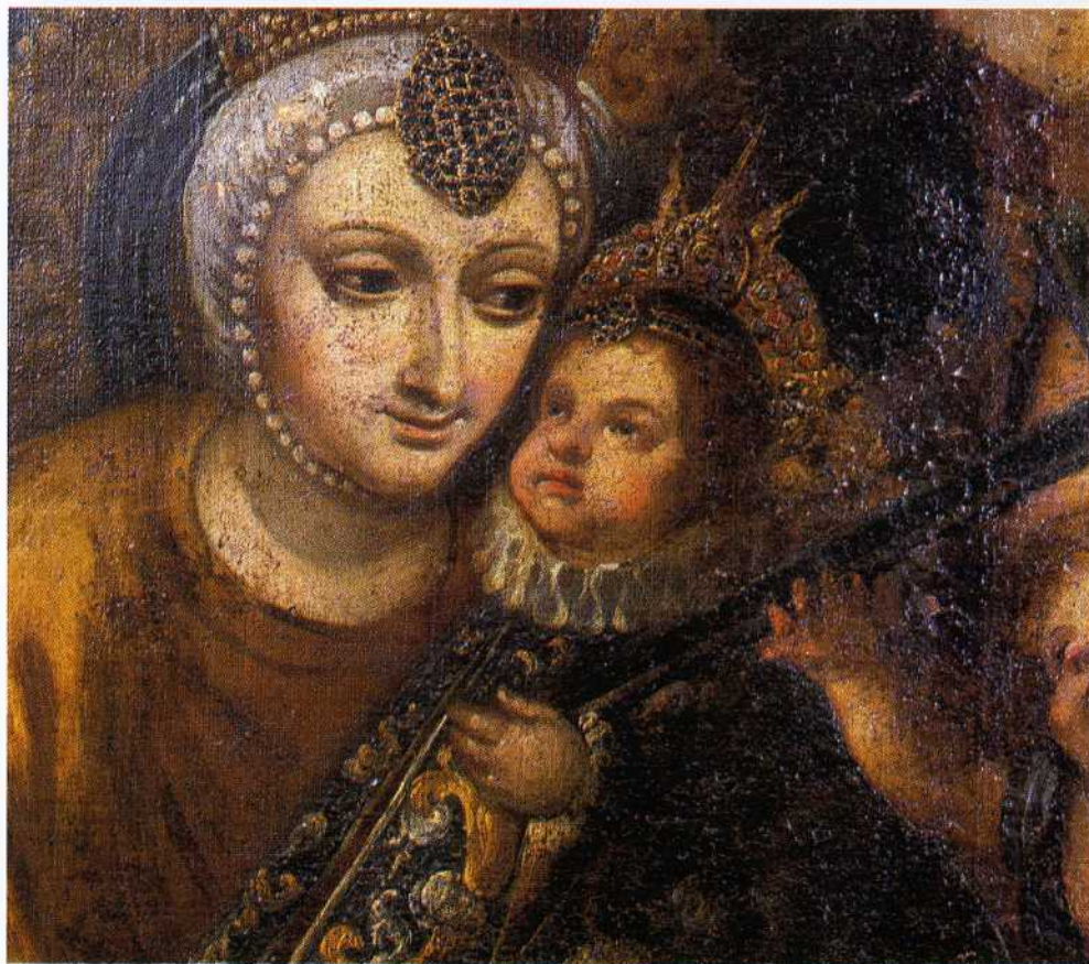
Fig.19. Detalle del rostro de la Virgen y el Niño en la Milagrosa labra de la Virgen de los Desamparados.