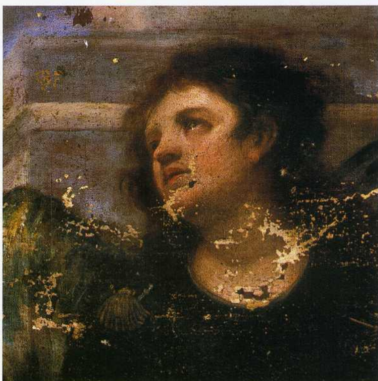
Fig.16. Detalle de uno de los ángeles en tres cuartos representados en La milagrosa labra de la Virgen de los Desamparados .