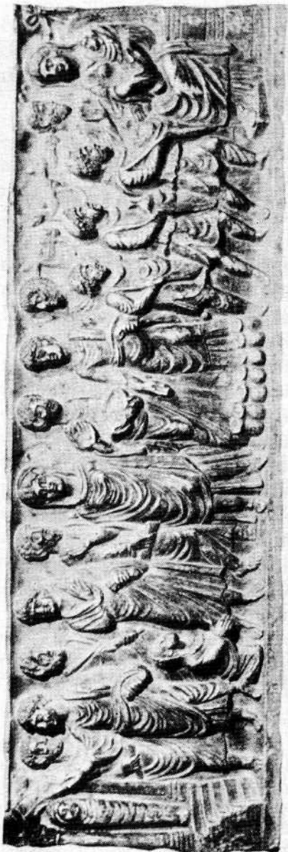
28.- Sarcófago de Castiliscar (Zaragoza). Mediados del S. IV. La Adoración de los Magos se combina con la Resurrección de Lázaro, puestas ambas escenas en cada extremo, hecho que ha estado interpretado como el principio y el fin de la Historia de la Salvación: el inicio de la Encarnación redentora de Jesús, y el final de ésta con la Resurrección de la carne.