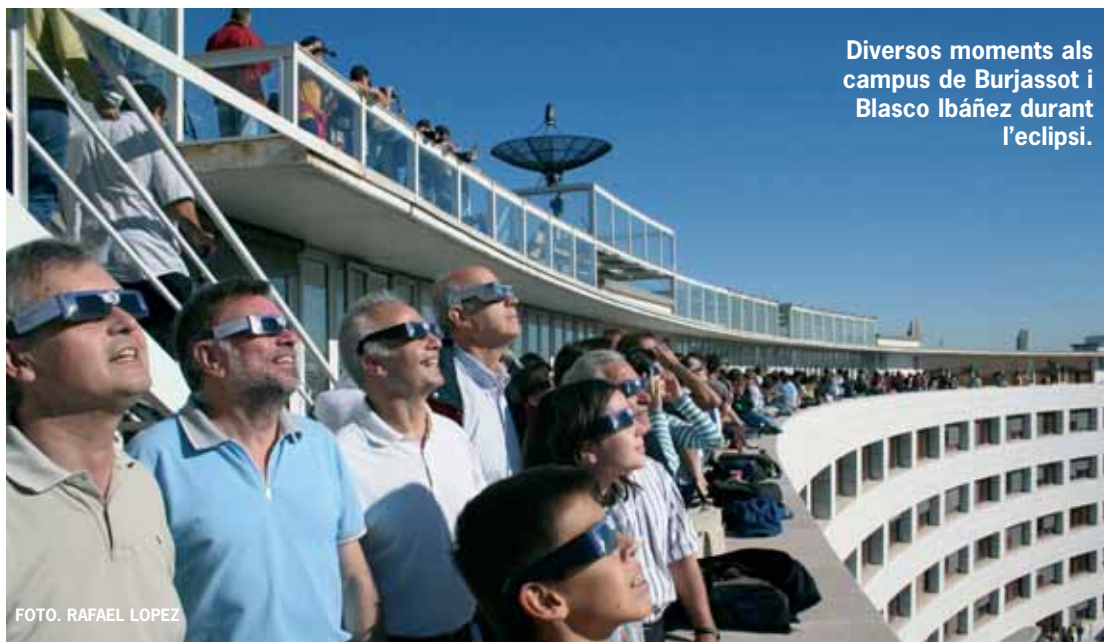
Diversos moments als campus de Burjassot i Blasco Ibáñez durant l'eclipsi.

Es van habilitar dues sales multimèdia del campus per a veure l'eclipsi a través de la xarxa informàtica de la Universitat. "A les 9 ho-