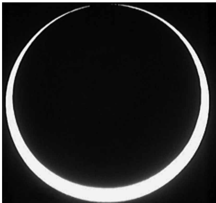
Moment del segon contacte, en què el disc de la lluna entra dins del disc solar, observat en el telescopi apocromàtic de l'Aula d'Astronomia.