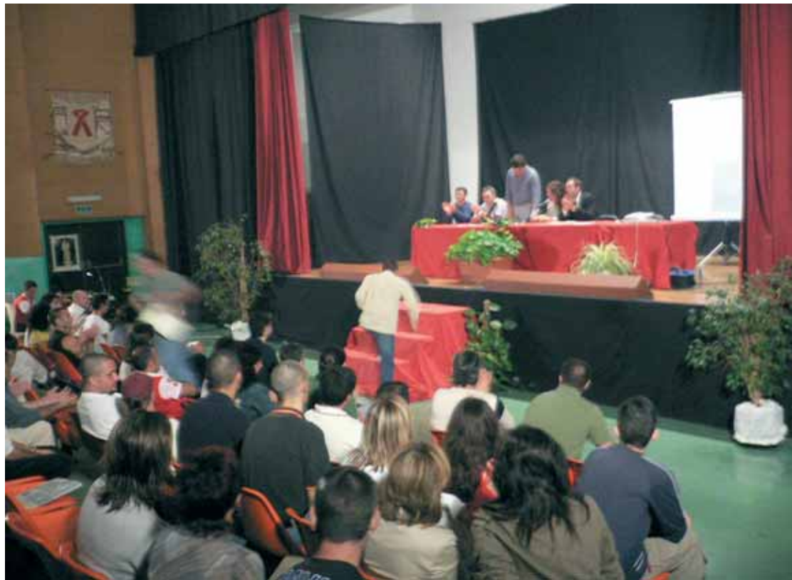
Un moment de l'acte de cloenda de la Universitat d'Estiu a Picassent.