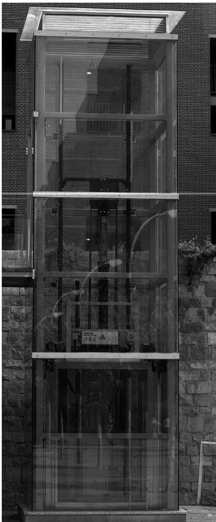
Imatge del nou ascensor de cristall de la Biblioteca de Ciències Socials Gregori Maians.

La de València és la universitat espanyola que més estudiants amb discapacitats té de forma presencial. Aquest resultat és fruit de l'esforç que la institució està duent a terme per a fer més accessibles els campus i les facultats. Una tasca que està encetada però a la qual encara li queda molt a fer. La passada setmana la Delegació per a la Integració de Persones amb Discapacitat presentà l' Estudi d'Accessibilitat Física a la Universitat de València .