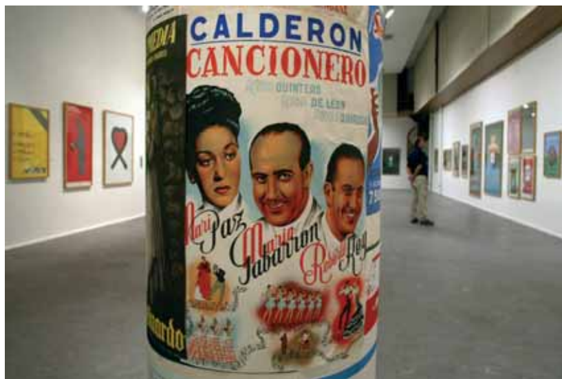
Obres de Richard Avedon, George Grosz, Le Corbusier i Sonia Delaunay. Sobre aquestes línies, imatge de l'exposició al Muvim.

també ha agraït a la CAM i a la Diputació que la Universitat forme part d'un itinerari artístic per a des-