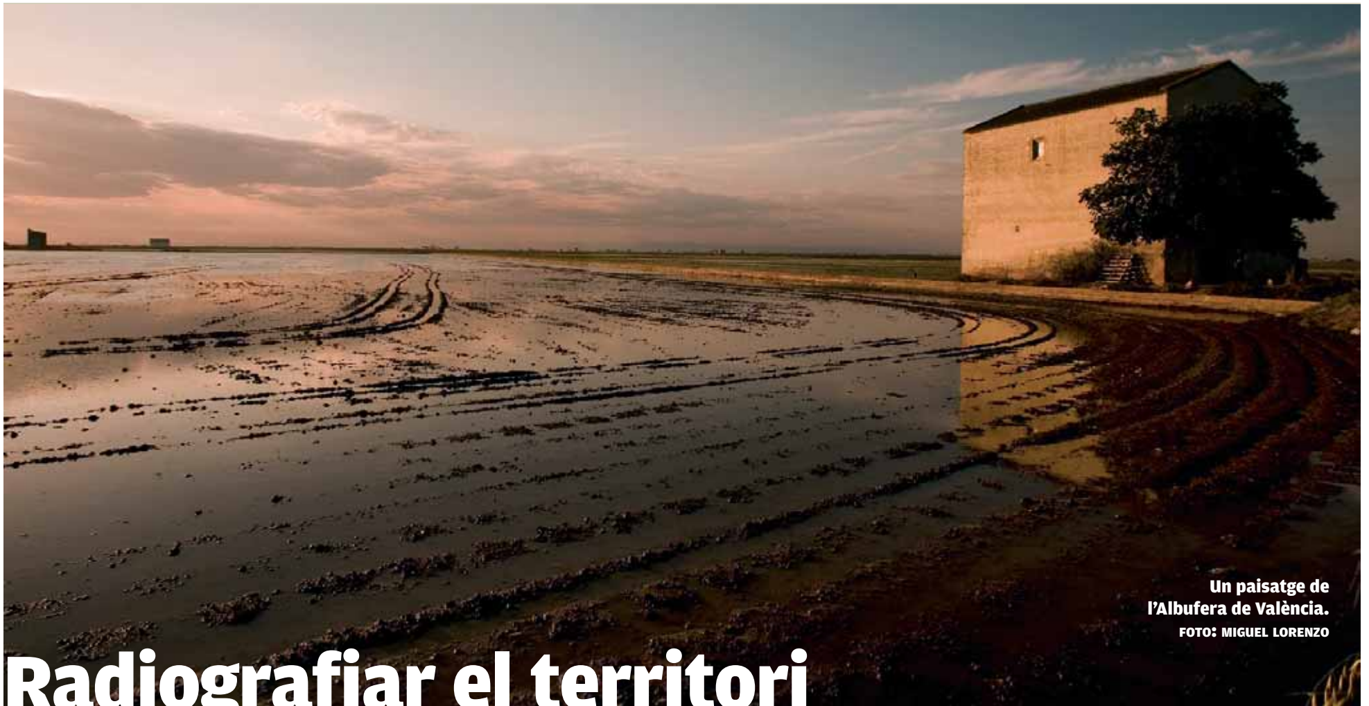
Un paisatge de l'Albufera de València.