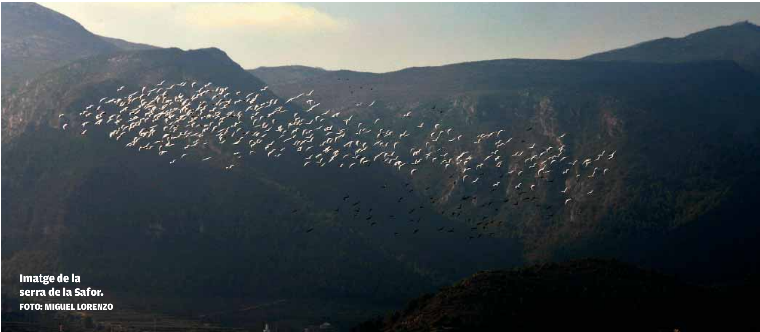
Imatge de la serra de la Safor.