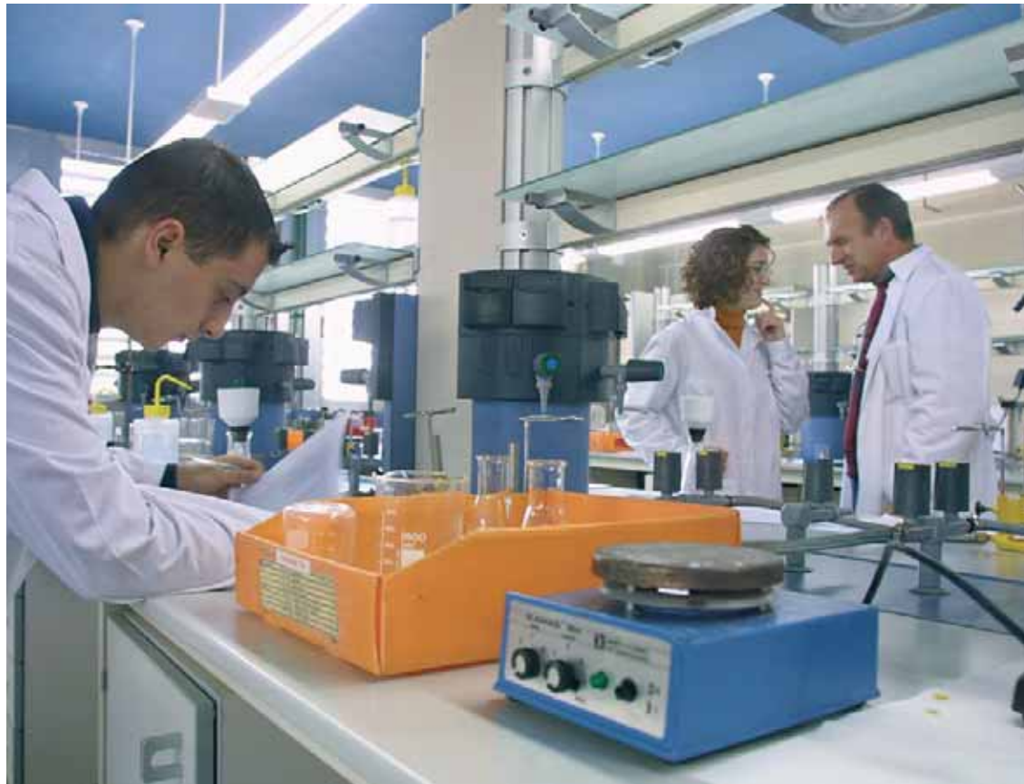
Un dels departaments de Química de la Universitat.