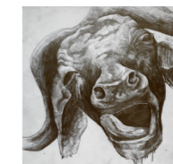
Pascal Laborde Roots, 2007