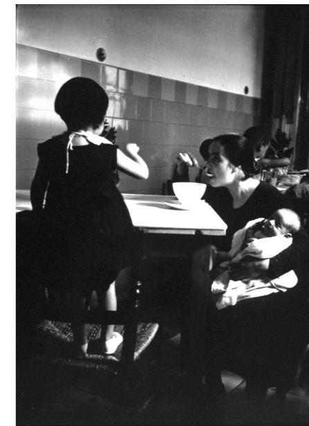
Kati Horna Comité de refugiados en «Alcázar de Cervantes» [s. f]. Publicada en Umbral , 12 [2 de octubre de 1937].