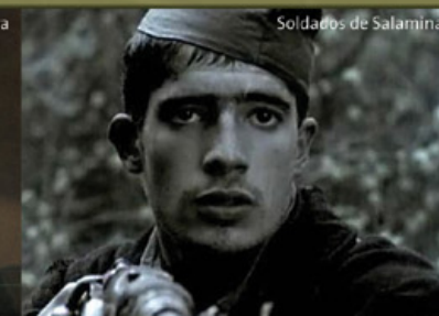
Soldados de Salamina