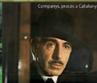
Compagnys, procès a Catalunya