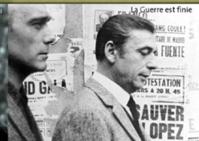
La Guerre est finie