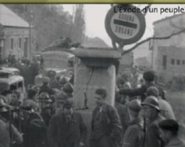
L'Exode d'un peuple

14h30 La Guerre est finie , Alain Resnais, Fr. 1966, 2h01