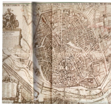
-plànol de València-

L’ambient intel·lectual valencià, doncs, s’havia manifestat avançat i receptiu i Climent fou, a la vegada, objecte i subjecte d’aquell ambient. Mestre afirma que “...la efervescència intel·lectual es, por tanto, viva e