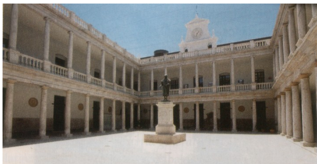
-claustre de la Nau-