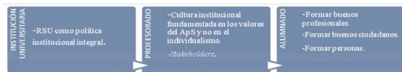
Figura 1. Visión acerca del ApS por parte de los responsables institucionales.

ner y proyectarse en la vida social, económica, política, ideológica y religiosa (en el caso de que se desee). Formar sujetos emprendedores, críticos con el establishment , pero también personas con capacidad de aprender a lo largo de toda la vida, para ir ajustándose a las demandas del entorno laboral, o incluso adelantarse a ella.