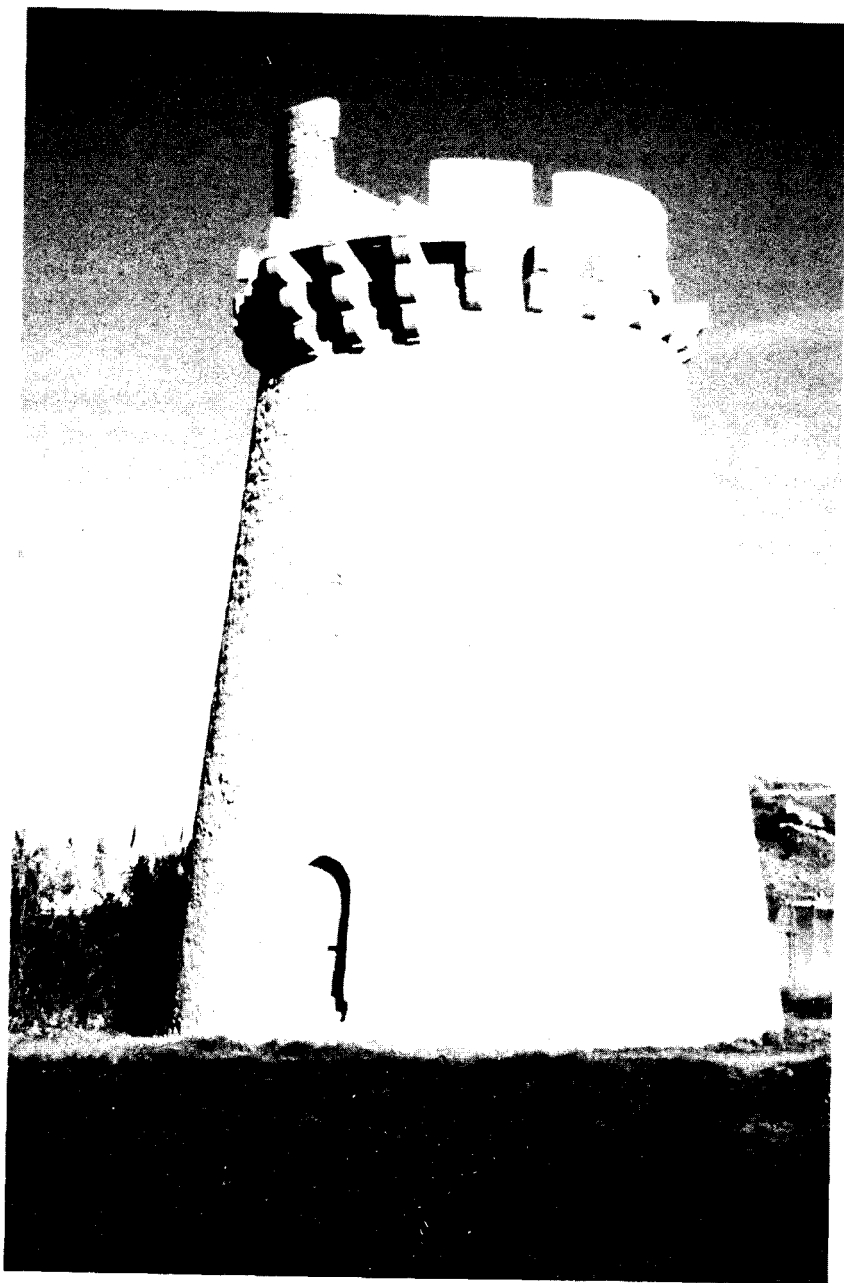
Figura 3. Torre del Marenyet en la antigua desembocadura del río Júcar, Cullera. Sobre el acceso inscripción conmemorativa de Vespasiano Gonzaga.