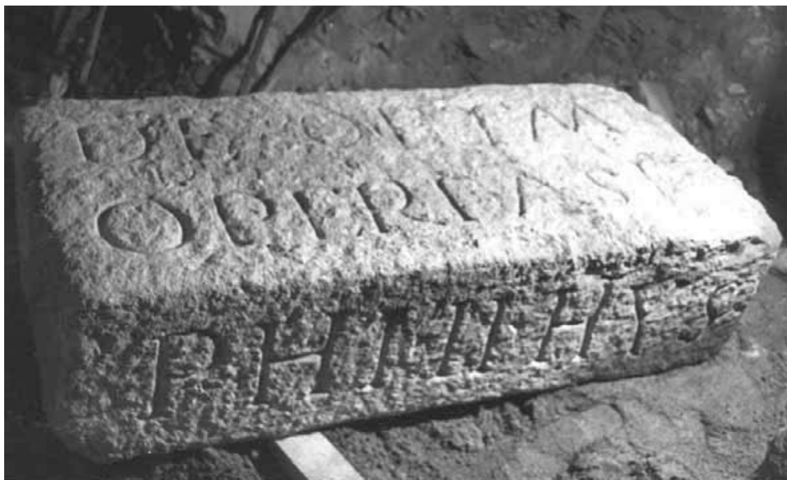
Fig. 1. Primera piedra de El Escorial, colocada en 1563 y hallada en 1971, Archivo de las Oficinas de la Delegación del Escorial

Roma. Además, para cada edificio religioso se estableció un ritual de consagración, inspirado en la Biblia y en las interpretaciones de los teólogos. El apoyo de Constantino al cristianismo permitió una dimensión pública, que se manifestó en la consagración de edificios y la construcción de otros. Las festividades guiadas por los obispos y con la concurrencia de multitudes son descritas por Eusebio de Cesarea en su Historia Eclesiástica . El rito se irá formando, con especificidades locales: Roma, Galia, Bizancio, Hispania..., y permeables. Por ejemplo, la placa de marfil que probablemente sirvió en un relicario, realizada en Bizancio en el siglo V y hoy custodiada en la catedral de Trier (Alemania), muestra una ceremonia de la corte bizantina relacionada con la llegada de una reliquia 7 ante una iglesia en construcción, pero en las labores de finalización, mientras personas agitan incensarios, por lo que se ha asociado al rito de la consagración de una iglesia. En el papado de Gregorio Magno (590-604), quien estuvo en Constantinopla, se introduce el uso de reliquias en el acto de consagración. La procesión y depósito de las mismas se convirtió en uno de los más importantes y solemnes actos en los ritos de dedicación de iglesias y altares. 8 En este tiempo se constata la celebración de una misa por el obispo, la aspersion de agua bendita para exorcizar y el uso de brandea en