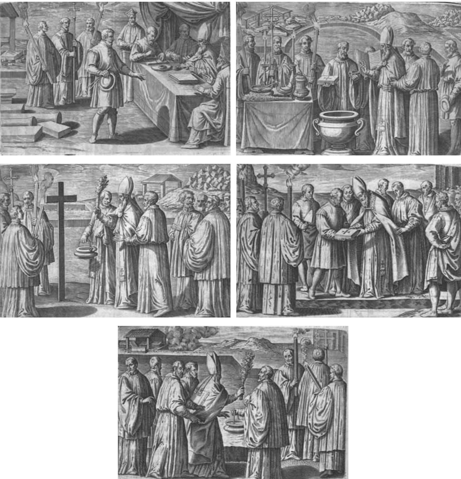
Fig. 2. Pontificale Romanum. Clementis VIII. Pont. Max. Iussus restitutum atque editum , Roma, 1595