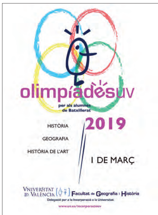
Fig. 1. Cartel de las Olimpiadas de Historia del arte para alumnado de Bachillerato.