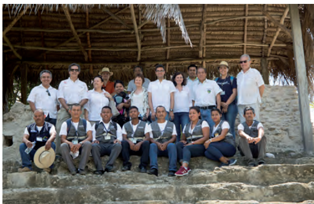
Fig. 21. Foto de grupo, con la presencia de la rectora de la Universitat de València, durante el recorrido por las ruinas arqueológicas en el acto del día 27 de mayo de 2019.