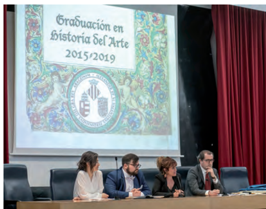
Fig. 22. Momento del acto de graduación en Historia del Arte de la Universitat de València, promoción 2015-2019.

mo, el Departamento contribuye con la entrega de un diploma personal conmemorativo y el padrino y madrinan les imponen una beca azul celeste, como corresponde tradicionalmente a los estudios de la rama de Humanidades.