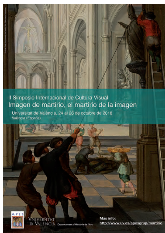
Fig. 14. Cartel del Simposio Internacional Imagen de martirio, el martirio de la imagen .