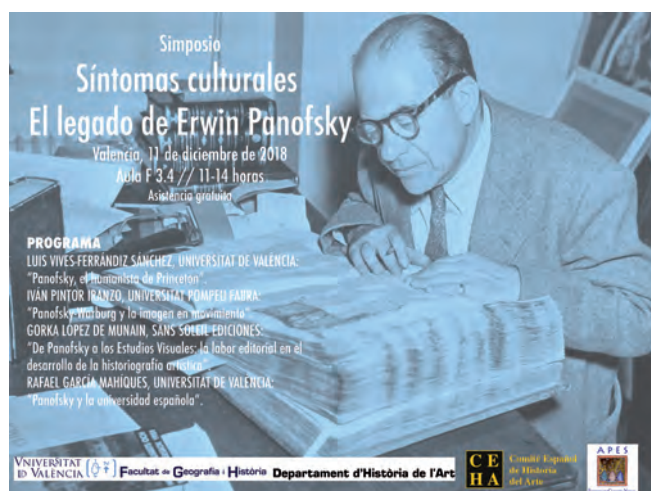
Fig. 15. Cartel del simposio Síntomas culturales. El legado de Erwin Panofsky .