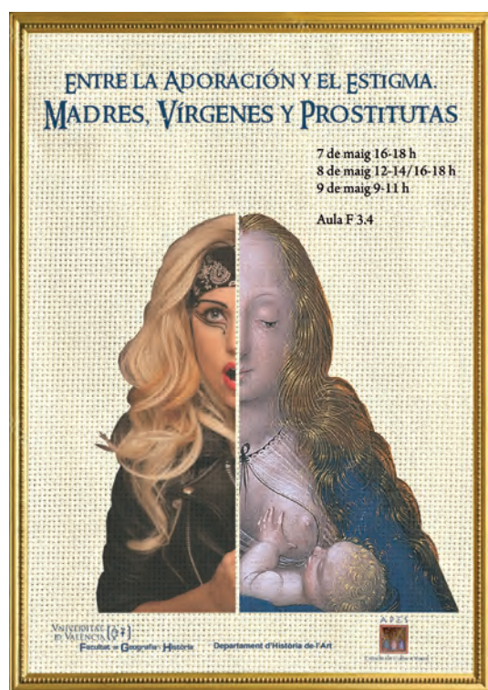
Fig. 3. Cartel del seminario Entre la adoración y el estigma .

Además, es habitual que en el desarrollo de las asignaturas se cuente con la participación de conferenciantes , especialistas en algún tema del con-