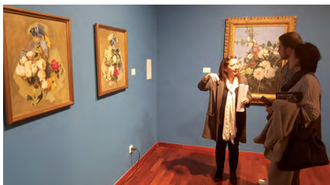
Fig. 13. Exposición Efímeras y eternas. Pintura de flores en Valencia (1870-1930) en la Casa-Museo Benlliure de Valencia.