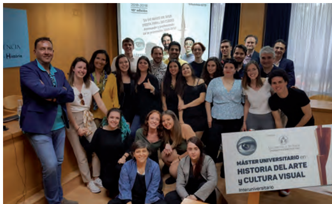
Fig. 10. Foto colectiva en el acto de clausura del Máster en Historia del Arte y Cultura Visual, curso 2018-2019.