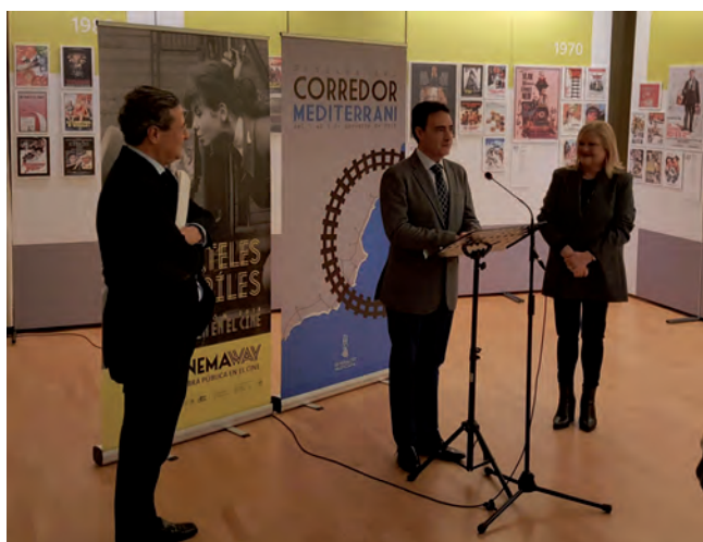
Fig. 19. Presentación de la exposición Carteles y raíles y del proyecto Cinemaway en el Ateneo Mercantil de Valencia que dio origen a múltiples actividades.