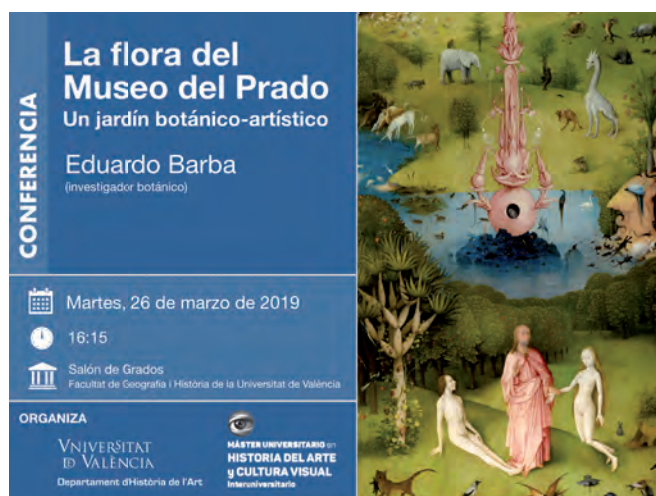
Fig. 9. Cartel de la conferencia de Eduardo Barba sobre “La flora del Museo del Prado”.