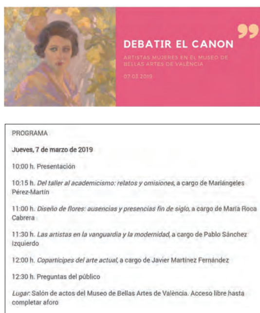
Fig. 16. Anuncio de la jornada Debatir el canon: artistas mujeres en el Museo de Bellas Artes de Valencia .