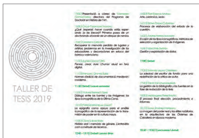
Fig. 11. Programa del IV Taller de tesis: Experiencias para doctorandos/as en Historia del arte.

El Departament d'Història de l'Art participa también en títulos propios de postgrado, dependientes de la Fundación Universidad-Empresa ADEIT. Es el caso de la tercera edición del Diploma de especialización en Fotografía: producción y creación y de la cuarta edición del Máster propio en Fotografía: producción y creación , de 45 y 60 créditos respectivamente, organizados por el Departament d'Història de l'Art y Espai d'Art Fotogràfic,