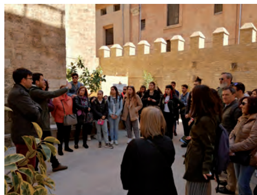
Fig. 2. Visita a San Juan del Hospital, València.

En un título como el de Historia del Arte el acercamiento al objeto artístico no puede ni debe hacerse solamente a través del trabajo en el aula. Es habitual que el profesorado organice salidas de estudiantes de distintas asignaturas a espacios urbanos, monumentos, museos, archivos y otras instituciones de la ciudad de Valencia y de diversas localidades. En 2018-2019 se visitaron, entre otros, el Museo Nacional de Cerámica y Artes Suntuarias "González Martí", el Museo de Bellas Artes de Valencia, el convento de Santo Domingo, el Monasterio de la Trinidad de Valencia, el Real Colegio Seminario del Corpus Christi, el edificio histórico de la Universitat de València, el Monasterio de San Miguel de los Reyes, el templo de San Nicolás, la iglesia de San Juan del Hospital, la Lonja, la catedral o el barrio de la Valencia gòtica.