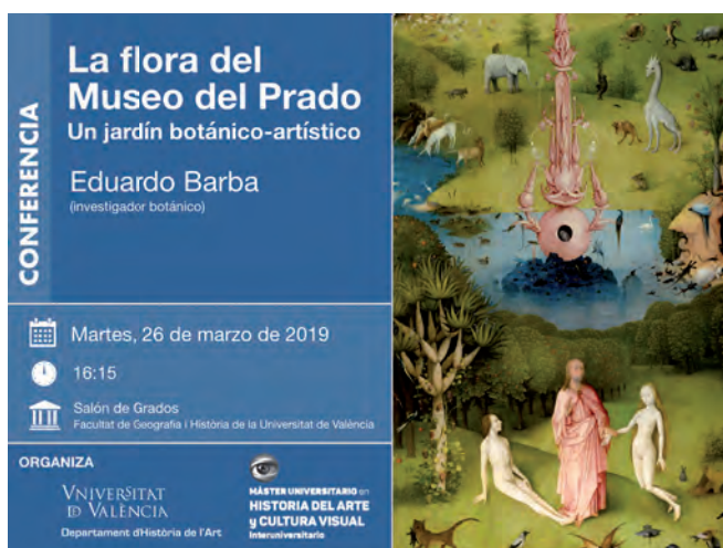
Fig. 9. Cartel de la conferencia de Eduardo Barba sobre "La flora del Museo del Prado".