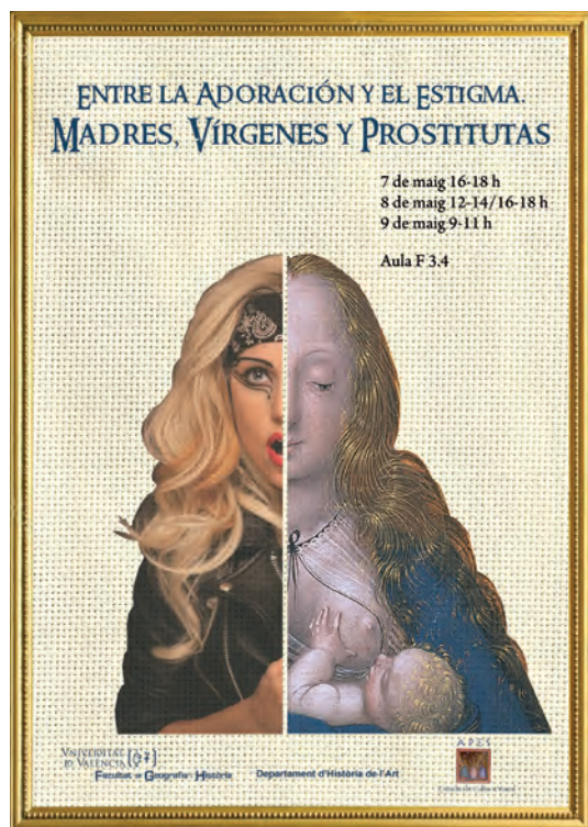
Fig. 3. Cartel del seminario Entre la adoración y el estigma .

Además, es habitual que en el desarrollo de las asignaturas se cuente con la participación de conferenciantes , especialistas en algún tema del con-