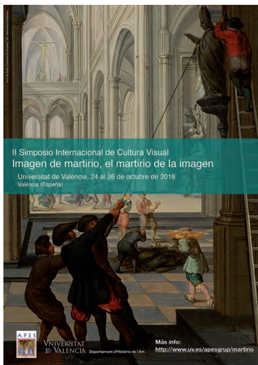
Fig. 14. Cartel del Simposio Internacional Imagen de martirio, el martirio de la imagen .