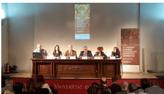
Fig. 17. Acto de inauguración del congreso ESRARC 2019 en La Nau.

partió la conferencia “Nuevas aportaciones del estudio de las pinturas románicas y el artesanado mudéjar de La Sala Capitular del Real Monasterio de Santa María de Sijena”, celebrada en el salón de actos de San Juan del Hospital.