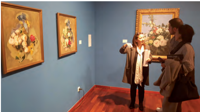
Fig. 13. Exposición Efímeras y eternas. Pintura de flores en Valencia (1870-1930) en la Casa-Museo Benlliure de Valencia.