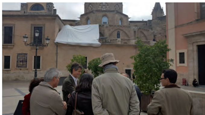
Fig. 7. Visita a la zona afectada de la catedral de Valencia por parte del grupo de especialistas del Departament d'Història de l'Art junto al arquitecto del Cabildo.

cuando se recibe una solicitud formal por parte de algún colectivo, particular y fundamentalmente, de la propia Universitat de València, como órgano consultivo legalmente establecido por la Administración, se activa el trabajo de un grupo de personas especialistas en dicho ámbito. Algo similar ocurre cuando se observan actuaciones que no se consideran acordes con la normativa de protección de bienes, como sucedió en el caso del edificio del antiguo cine Metropol en 2017 y 2018. Desde el Departament d'Història de l'Art de la Universitat de València se realiza un trabajo paralelo no remunerado, con el consenso de sus órganos de gobierno, para emitir dichos informes y remitirlos a las instituciones implicadas. En marzo de 2019, por ejemplo, se recibió desde la Direcció General de Cultura i Patrimoni de la Generalitat Valenciana la solicitud de un dictamen acerca del proyecto de intervención en la fachada de los absidiolos y cubierta de la cúpula del relicario de la catedral de Valencia, declarada Bien de Interés Cultural con la categoría de monumento histórico-artístico desde 1931. El informe detallado fue aprobado por el Consejo departamental y remitido a la Generalitat Valenciana para cumplir su función.