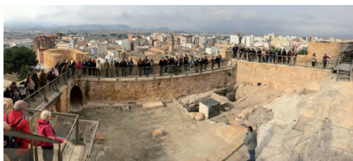
Fig. 4. Visita al castillo de Villena.