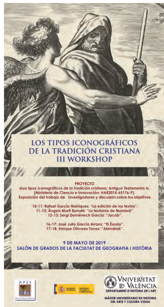
Fig. 18. III Workshop Los tipos iconográficos de la tradición cristiana .