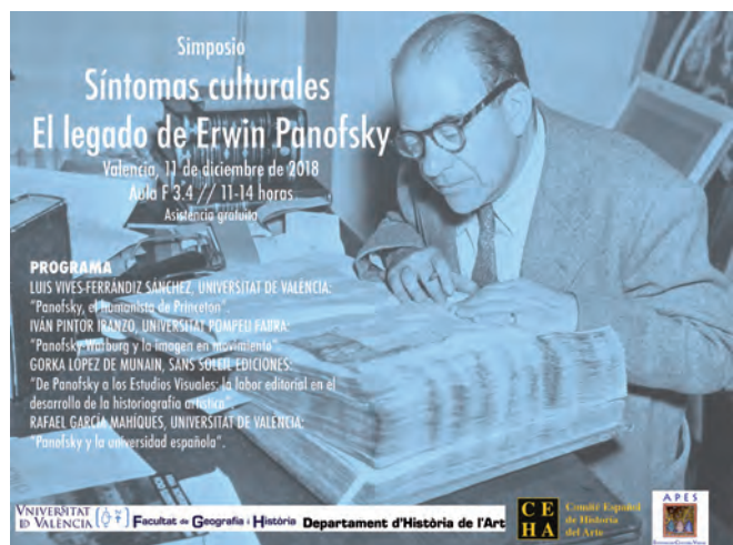
Fig. 15. Cartel del simposio Síntomas culturales. El legado de Erwin Panofsky .