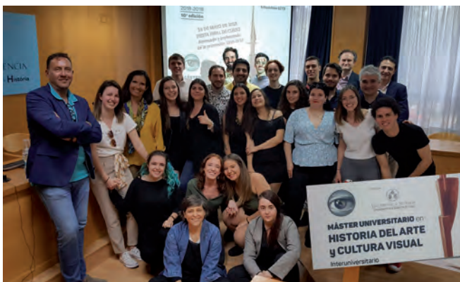
Fig. 10. Foto colectiva en el acto de clausura del Máster en Historia del Arte y Cultura Visual, curso 2018-2019.