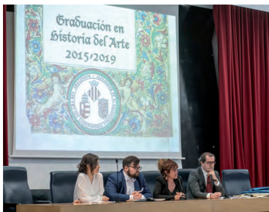
Fig. 22. Momento del acto de graduación en Historia del Arte de la Universitat de València, promoción 2015-2019.

mo, el Departamento contribuye con la entrega de un diploma personal conmemorativo y el padrino y madrinas les imponen una beca azul celeste, como corresponde tradicionalmente a los estudios de la rama de Humanidades.