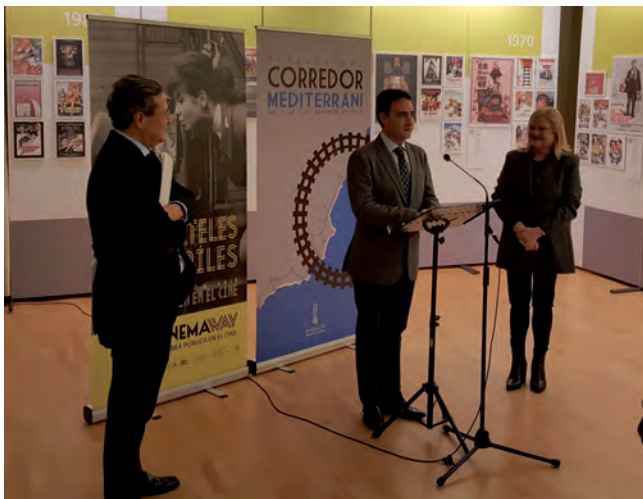
Fig. 19. Presentación de la exposición Carteles y raíles y del proyecto Cinemaway en el Ateneo Mercantil de Valencia que dio origen a múltiples actividades.