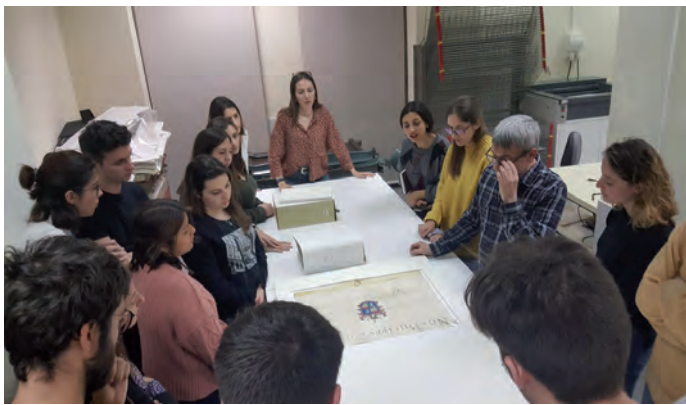
Fig. 5. Taller de fuentes documentales en el Archivo del Reino de Valencia.