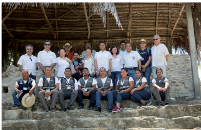
Fig. 21. Foto de grupo, con la presencia de la rectora de la Universitat de València, durante el recorrido por las ruinas arqueológicas en el acto del día 27 de mayo de 2019.