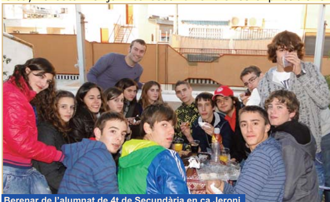
Berenar de l'alumnat de 4t de Secundària en ca Jeroni.