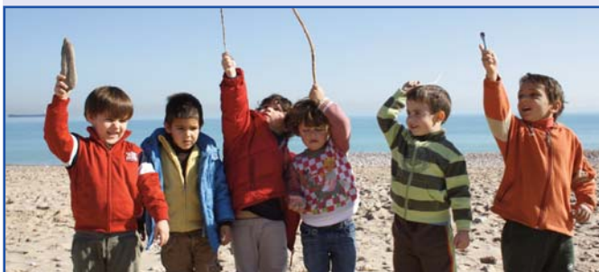
Dues fotografies del dia de platja d'Infantil. L'oratge ens acompanyà.

Ens va eixir un dia fantàstic per a l'eixida a la platja que xiquets i xiquetes d'Infantil van fer dimecres 3 de febrer. S'ho van passar genial, van tirar pedres a la mar, van jugar amb l'arena, van córrer, van fer castells i vam passar un dia molt divertit.