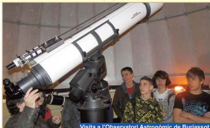
Visita a l'Observatori Astronòmic de Burjassot.