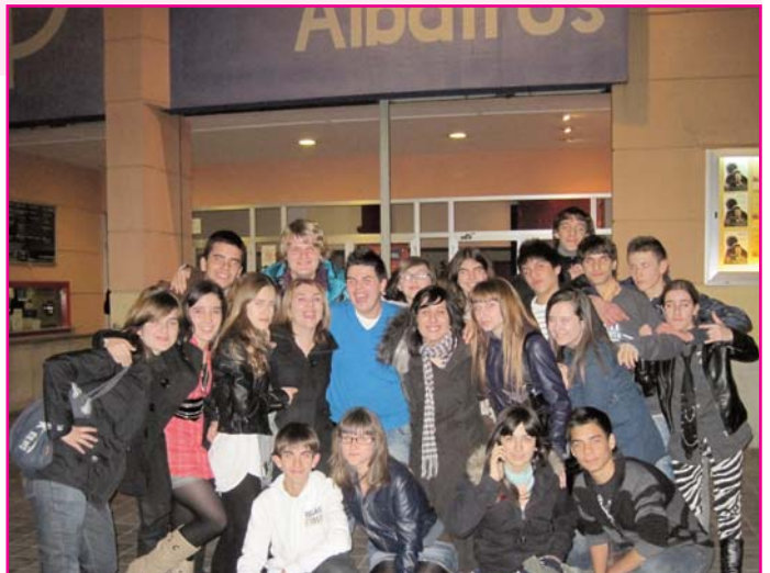
Alumnat de 3r d'ESO a la porta dels Albatros. Una nit de cinema i sopar.