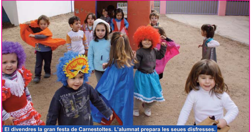
El divendres la gran festa de Carnestoltes. L'alumnat prepara les seues disfresses.