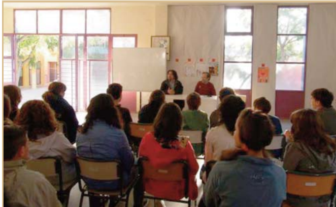
Conferència d'un maputxe a l'alumnat de Secundària.

Quan Endesa projectà construir la presa del Bio Bio els dirigents maputxes informaren què era una zona sísmica. Fa uns anys hagueren d'obrir inesperadament les comportes de la presa perquè havia plogut molt, el riu augmentà moltíssim el seu cabdal i moriren 23 persones.