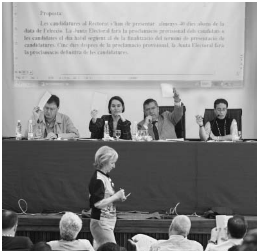
Una imatge de l'últim Claustre.

contra, es mantenia la redacció dels articles les objeccions als quals no es consideraren de legalitat, sinó de caràcter polític.