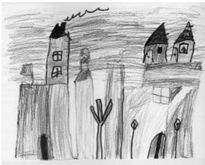
Dues imatges del Palau de la vila d'Ontinyent.

Cultura Visual a Ontinyent conté una part introductòria on l'autor aborda la dialèctica entre l'entorn global i local, la importància de la cultura visual i la seua possibilitat de superar fronteres, i aporta els fonaments a partir dels quals s'entén l'anàlisi posterior.