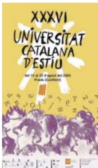
Cartell de la XXXVI edició.

A les nits, i per a tots els matriculats, hi ha concerts a les 21 hores a la plaça de la vila i a les esglésies de Catllà, Taurinyà, Molig i l'abadia de Sant Miquel