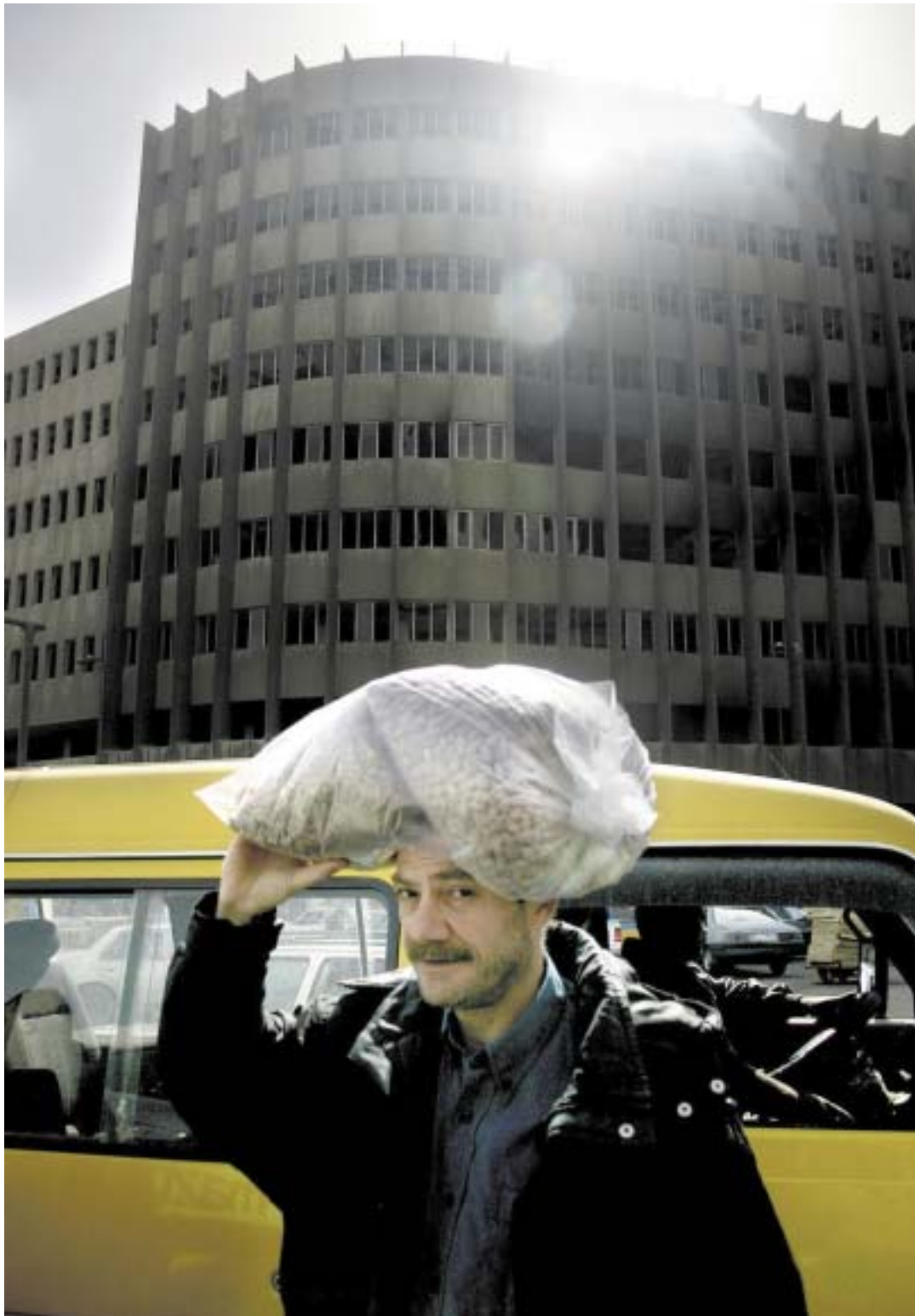
Un fotograma del documental dirigit per Félix Merino.