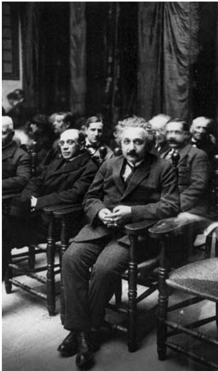
Einstein a l'Escola Industrial de Barcelona.

En febrer del 1923, Albert Einstein va passar uns dies a Barcelona convidat per la Mancomunitat de Catalunya. La seua visita, centrada en tres conferències que el físic va impartir al Palau de la Generalitat, davant un gran nombre d'experts i també d'aficionats, pretenia impulsar una comunitat científica moderna i donar a la cultura catalana un prestigi cada vegada més gran. I és que, pocs anys abans, l'autor de les teories de la relativitat havia saltat a la fama mundial arran d'un comunicat de la Royal Society de Londres que assegurava que els resultats de les seues observacions en l'eclipsi de maig del 1919 eren compatibles amb les prediccions de la teoria general de la relativitat; teoria que donava elements per a una nova interpretació de l'univers i que atorgava a la figura d'Einstein una popularitat i un prestigi més enllà de la comunitat de físics i matemàtics que conformaven el seu públic natural. "A Barcelona, el científic alemany es va veure envoltat d'ensenyants, enginyers, bibliotecàries, dirigents sindicals, ecle-