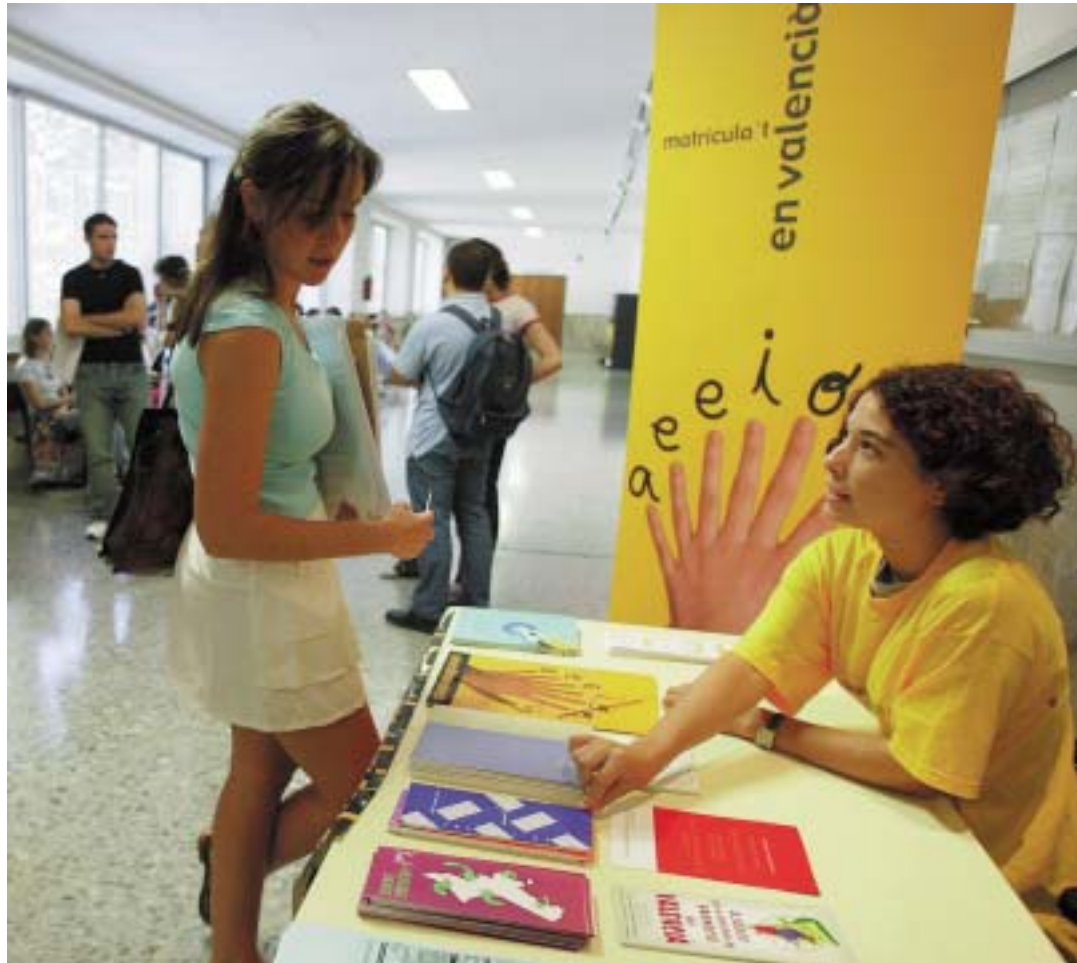
Estudiants de la Universitat durant una campanya de matriculació en valencià.

treball que podria derivar en la creació d'una comissió mixta.