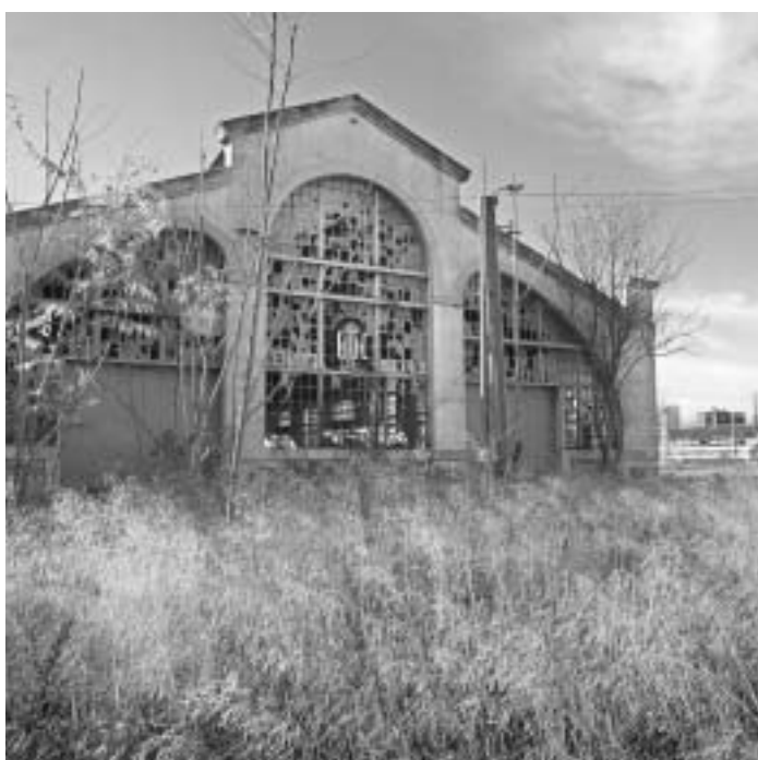
Imatge de l'edifici de Demetrio Ribes que allotjarà el seu futur museu.

El resultat del I Premi Demetrio Ribes es farà públic el dia 15 de