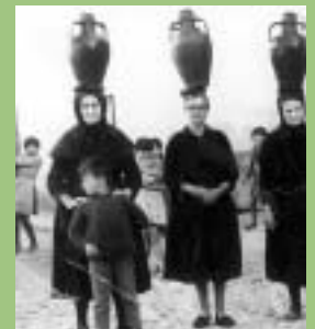
Aguadoras (Cáceres, 1950).