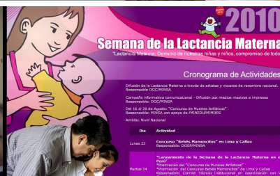
Figura 7. Promoción de la lactancia materna en Perú