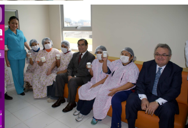
Figura 8. Recogida de leche con la presencia del Ministro de Sanidad peruano