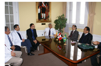
Figura 3. Negociación política del INMP y la Universitat de València con el Ministerio de Sanidad para la promoción de la lactancia materna