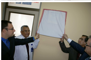
Figura 6. Inauguración del Banco de Leche Materna (Agosto 2010)