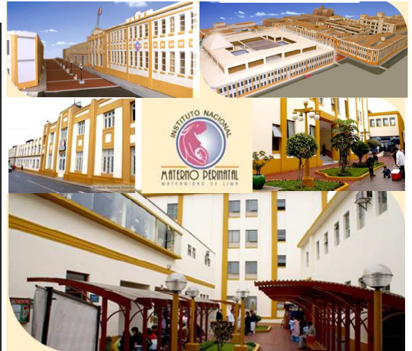
Figura 1. Instituto Nacional Materno Perinatal de Lima (Perú)