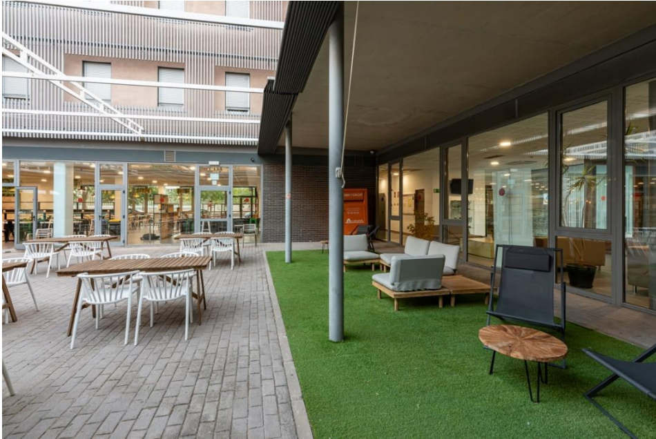
Residencia Universitaria Resa Damià Bonet Campus dels Tarongers, Carrer del Serpis, 27, 46022 València

La residencia es moderna, amplia y con instalaciones y servicios premium. Está ubicada en una zona perfecta, exactamente en la calle Serpis 27, justo al lado del Centre d'Idiomes UV en el Campus dels Tarongers de la UV. La comodidad de los estudiantes es una de sus premisas y la localización del edificio facilita un acceso rápido a las clases del centro de idiomas y a la zona universitaria.