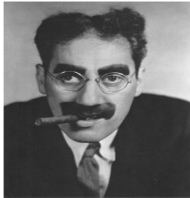
Asesor de la Policía

Lo dicho, estamos segur@s que este incidente no saldrá nunca en “Policías en acción”.