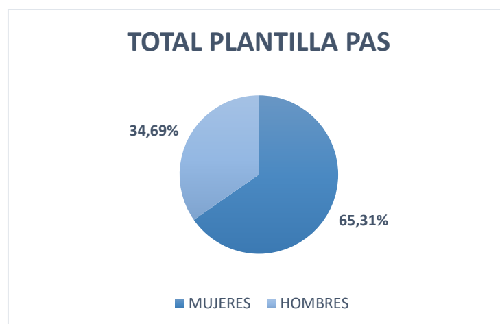
Gràfica 1.- Distribució percentual per gènere.

A data de publicació de la OEP 2021, la distribució percentual per sexe en el total de la plantilla de personal d'administració i serveis (1.260 persones) mostra que el percentatge de dones (65,31%) és gairebé doble al d'homes (34,69).