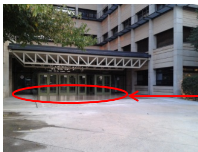
Petició de pis antidesliçant