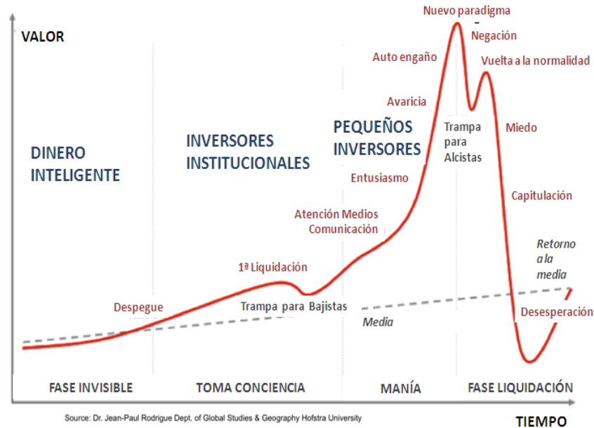
Figura 1. Esquema de las Etapas de la Burbuja Económica