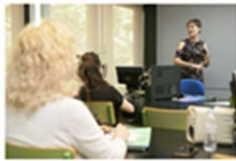
La Clínica de Logopedia inaugura la "Escuela de veu per a docents" 31 octubre, 2019