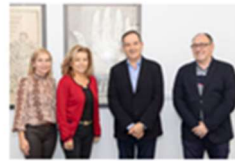
AFAV y la Clínica de Logopedia firman un convenio de colaboración 23 octubre, 2019