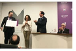
El Director de la CUNAFF nombrado Académico correspondiente de la Academia de Farmacia de la CV