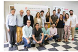
Finaliza la 16ª Edición del Máster Propio en Cirugía Oral e Implantología