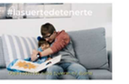
Hoy se celebra el Día Mundial del Síndrome de Down