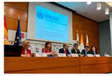
La Clínica de Psicología participa en las jornadas técnicas de formación para la atención y rehabilitación de las drogodependencias 1 marzo, 2019