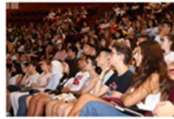
¡Bienvenidos a la Universitat de València! – Apertura de Curso Académico 2019/20