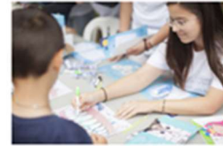
Las Clínicas de la Universitat en la gran fiesta de la Ciencia: Expociència 2019