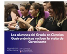
Los alumnos del Grado en Ciencias Gastronómicas reciben la visita de Germinarte 15 octubre, 2019