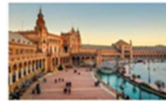
Isabel Menéndez gana el premio al mejor artículo de investigación sobre Cirugía Bucal en revistas de impacto extranjeras 2019 22 octubre, 2019