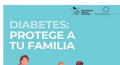
¡Hoy se celebra el Día Mundial de la Diabetes! 14 noviembre, 2019