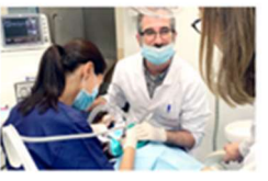
La Clínica Odontológica UV incorpora los servicios de sedación en la clínica de pacientes especiales