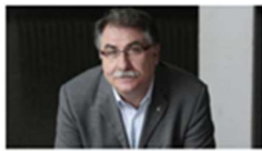
El Director de la Clínica de Psicología impartió ayer una conferencia sobre Hipnosis 16 octubre, 2019