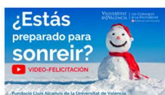
¡La Fundació os desea feliz navidad! 20 diciembre, 2019