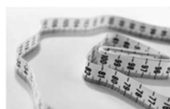
¡Hoy se celebra el Día Mundial de la Obesidad! 12 noviembre, 2019