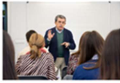
Comienza el Experto Universitario en Endodoncia Rotatoria y Microscópica 13ª Edición 8 noviembre, 2019