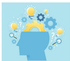
El Director de la Clínica de Psicología habla sobre la hipnosis en la Cadena Ser 11 diciembre, 2019