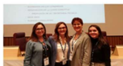
Las logopedas de la Clínica de Logopèdia de la FLA-UV participan en el XII Congreso de la SOCEFF 25 noviembre, 2019