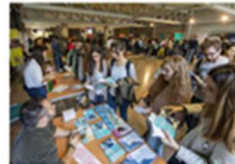
La Fundació Lluís Alcanyis UV participa en el Foro de Empleo y Emprendimiento 5 noviembre, 2019