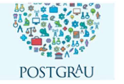
27 Títols Propios componen la oferta formativa 2019-2020