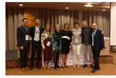
La Fundació participa en la XV Jornada de la Asociación Universitaria Valenciana de Blanqueamiento Dental 1 marzo, 2019