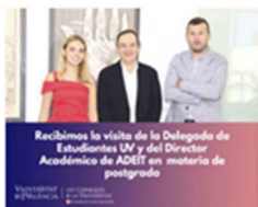
Recibimos la visita de la Delegada de Estudiantes UV y el Director Académico de Postgrado Propio de la UV 11 octubre, 2019