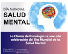
Desde la Clínica de Psicología participamos en la celebración del Día Mundial de la Salud Mental 14 octubre, 2019