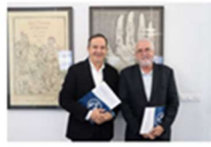
Down-Valencia y la Fundació Lluís Alcanyis firman un convenio de colaboración 7 noviembre, 2019