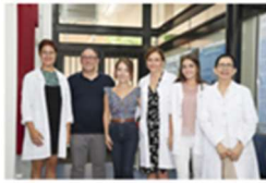
La Clínica de Logopèdia UV da la bienvenida a ERASMUS+