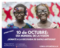
Último sprint para la recogida de gafas en el Día Mundial de la Visión 11 octubre, 2019