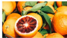
¡Celebramos el Día Mundial de la Alimentación bajo el lema #zerohunger! 16 octubre, 2019