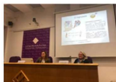
El 9 de Noviembre se realizaron las II Jornadas de Neuropsicología 21 noviembre, 2019