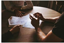
La Clínica de Psicología UV incorpora el servicio de Mediación