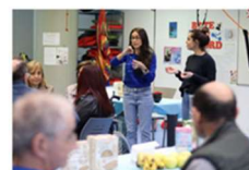
¡Hoy se celebra el Día Mundial de las Personas con Discapacidad! 3 diciembre, 2019