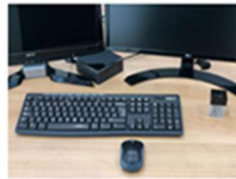
Nueva Oferta de trabajo: Oficial Administrativo en el Departamento de Contratación 30 octubre, 2019