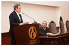
La Fundació participa en la Jornada por el Día Mundial de las Enfermedades Raras 28 febrero, 2019