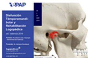
El Instituto EPAP organiza el curso "Disfunción Temporomandibular y Rehabilitación Logopédica" 14 febrero, 2019