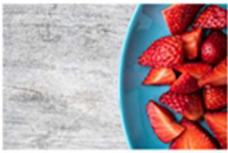
CUNAFF UV inaugura la Unidad de Asesoramiento Dietoterapéutico para Enfermedades Raras (UnADER) 28 febrero, 2019