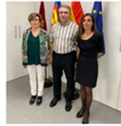
El director de la Clínica de Psicología UV imparte el seminario "Iniciación a la Hipnosis Basada en la Evidencia" 4 noviembre, 2019