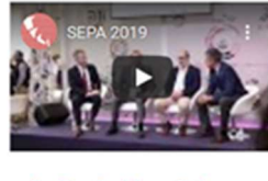
La Fundació participa en SEPA 2019