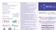
El próximo 15 de noviembre se celebra la 11ª Jornada Valenciana "Tabaquismo y Respiración" 13 noviembre, 2019