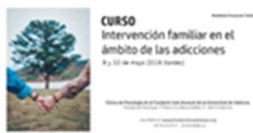
La Clínica de Psicología lanza el curso presencial y online "Intervención familiar en el ámbito de las adicciones" 10 enero, 2019