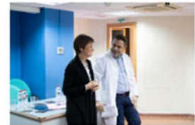
El Consejo de Dirección visita la Clínica Podológica 27 febrero, 2020