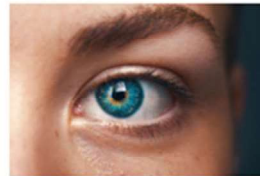
Hoy se celebra el Día Mundial del Glaucoma 12 marzo, 2020