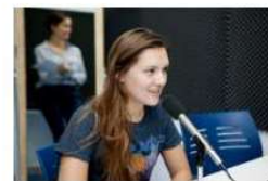
¡Hoy se celebra el Dia Mundial de la Voz! 16 abril, 2020