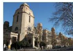
La Universitat de València se sitúa entre las mejores de España en el ranking URAP de producción científica 15 enero, 2020