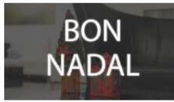
BON NADAL 18 diciembre, 2020