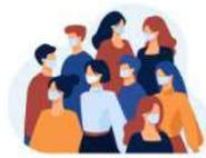
La Clinica de Logopedia de la Universitat de València da atenci3n a pacientes Post-COVID-19 26 octubre, 2020