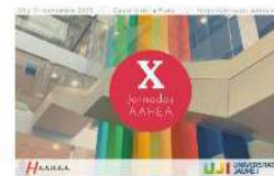
La Clinica de Psicologia UV participa activamente en las X Jornadas de AAHEA 14 octubre, 2020