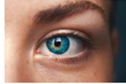
Consejos optométricos para cuidar tu visión 31 marzo, 2020