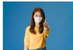
Dec1logo para hacer un buen uso de la voz con la mascarilla 19 octubre, 2020