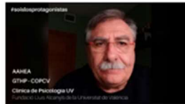
FRENANDO AL CORONAVIRUS: Ideas y sugerencias desde la Psicología #soislosprotagonistas 19 marzo, 2020