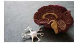
Uno de los usos m1s inadecuados de la hipnosis 16 noviembre, 2020