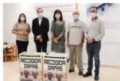
Visió Sense Fronteres recoge las gafas que se han entregado durante este a1o en la Fundaci3 8 octubre, 2020