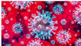
Información actualizada sobre el Coronavirus y la actividad asistencial de las Clínicas UV 24 marzo, 2020