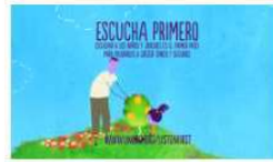
La Clinica de Psicologia UV colabora con la Oficina de las Naciones Unidas contra la Droga y el Delito (UNODC) 24 noviembre, 2020