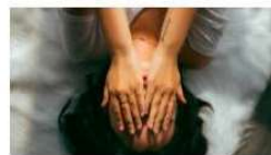
La Clinica de Psicologia UV crea una gui1a sobre el duelo ante el impacto del COVID-19 8 abril, 2020