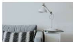
La Clinica de Psicologia UV lanza la GUIA para GESTIONAR SITUACIONES FAMILIARES durante el CONFINAMIENTO 7 abril, 2020