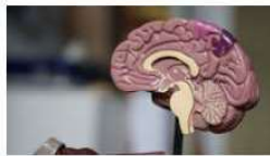
Dia Mundial del Ictus: sus sintomas y rehabilitaci3n 29 octubre, 2020