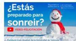
¡La Fundació os desea feliz navidad! 20 diciembre, 2019