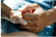
Día Mundial contra la Esclerosis Lateral Amiotrófica (ELA) 21 June, 2021