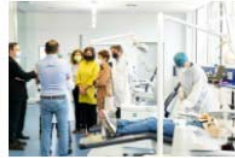
Visita en la Clínica Odontológica de la Universitat de València 20 May, 2021