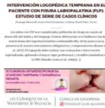
La Clínica de Logopedia participa en el XI Congreso Interdisciplinario de Atención temprana y Desarrollo Infantil 29 April, 2021