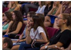
La Universitat de València realiza hoy la sesión de bienvenida del alumnado incoming