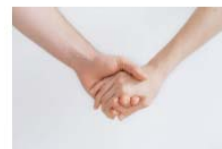
Curso intervención en víctimas de delitos contra la libertad e indemnidad sexual 21 September, 2021