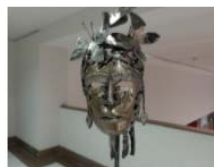
"El poder de las mariposas" inaugurada en la sala de exposiciones de la Facultad de Medicina y Odontología 23 September, 2021