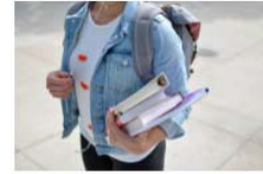
Los estudios de Odontología de la Universitat de València situados entre los mejores de España 13 May, 2021