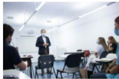
Se ha inaugurado el Máster Propio en Odontología Clínica Individual y Comunitaria 15ª Edición