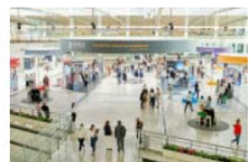
El Co-Director del Máster de Endodoncia UV presentó un monográfico en la DS World Madrid 2021 23 September, 2021