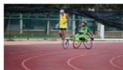
Hoy se celebra el Día Mundial de las Personas con Discapacidad 3 December, 2021