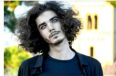
¡No tengas sustos este Halloween, cuida de tu visión! 29 October, 2021