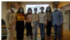
La Clínica de Psicología UV imparte una conferencia en la que se recalca la importancia de conocer los problemas de salud mental entre el alumnado 16 October, 2021