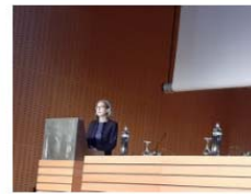
La FLA-UV presente en el Congreso Anual de la Sociedad Española de Epidemiología y Salud Pública Oral 15 October, 2021