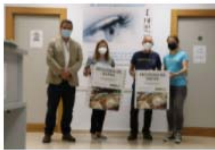
La Clínica Optomètrica UV entrega las gafas usadas a Visió Sense Fronteres en el Día Mundial de la Visión 14 October, 2021