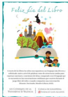
Día Internacional del Libro 23 April, 2021