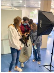
Los alumnos del Master en Odontología Comunitaria reciben la Masterclass de Fotografía Dental 5 November, 2021