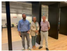
Profesorado del Máster en Endodoncia UV participa en una reunión de líderes de opinión en Odontología 15 October, 2021