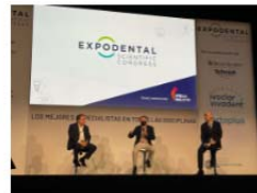
El Master en Endodoncia de la UV presente en el Congreso Expodental