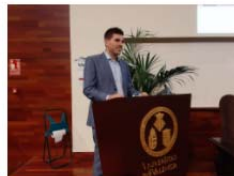
Entrega de Premios Extraordinarios del Grado en Odontología