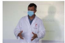
Empieza la 2ª edición del Diploma de Especialización en Gerodontología UV 7 October, 2021