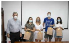
Se inaugura el Máster Propio Avanzado en Prótesis Dental 25ª Edición