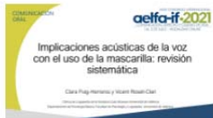
La Clínica de Logopedia participa en el XXXII Congreso Internacional de la Asociación Española de Logopedia, Foniatría y Audiología e Iberoamericana de Fonoaudiología (AELFA-IF)