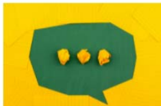
La Clínica de Logopedia participa en XI Congreso Interdisciplinar de Atención Temprana y Desarrollo Infantil la comunicación oral