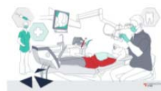
La Universitat de València se sitúa entre las 5 universidades destacadas para estudiar Odontología en España