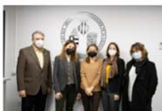
La Clínica de Psicología participa en el Proyecto ESPRINT 13 December, 2021

Els esdeveniments presencials en els quals ha participat la FLA, s'han vist reduïts. D'aquesta manera, la cobertura d'esdeveniments per part del Departament de Màrqueting i Comunicació s'ha vist centrada en la difusió en línia de comunicats, materials d'interès general i promocions de Títols Propis. Les notícies més importants de l'any: